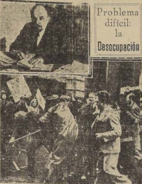
Uno de los problemas que Stalin juzga insolubles con la civilización actual es el de la desocupación. Arriba, Lenin, el creador de la revolución rusa. Abajo, Roosevelt, autor del programa de la N. R. A.

WELLS. — Ahora recuerdo la situación en que se hallaba, hace más de veinte años, la intelectualidad técnica. Ese número de intelectuales era entonces reducido, y en cambio el trabajo