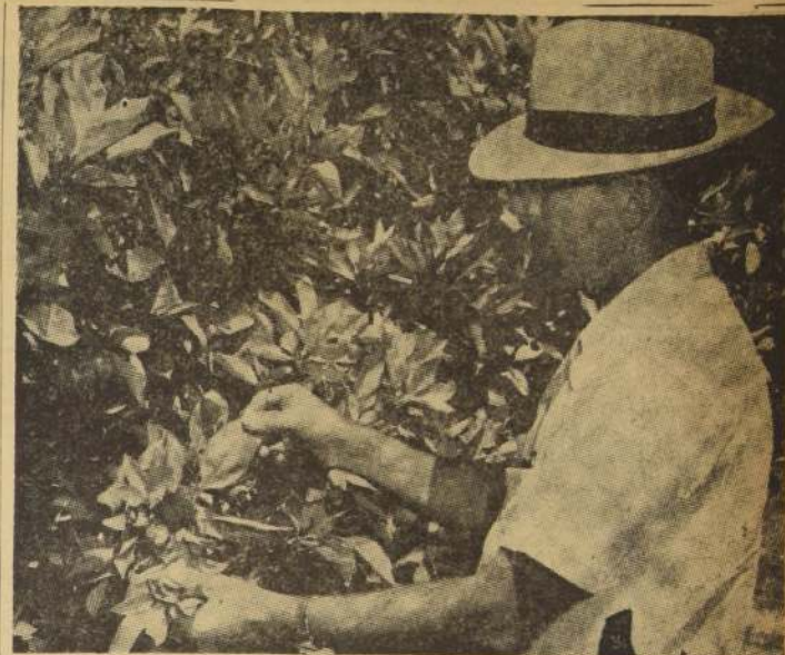
El valor del análisis foliar estriba en la uniformidad de los métodos con que se lleva a cabo el muestreo de las hojas del árbol.

MASHFOOD casero . . . . . $ 48. — kg. MASHFOOD ponedoras . . . . . $ 55. — " MASHFOOD, ración completa . . . . . $ 58. — " SCRACH (granos triturados) . . . . . $ 55. — " CON SACO PUESTO DOMICILIO EN SANTIAGO Haga sus pedidos por teléfono a los números 51315-52557 O en nuestras bodegas: Santa Rosa N.º 3280, Arizanos N.º 681 — Andrés Bello esq. Salas Menichetti Hnos. y Cía. SANTIAGO