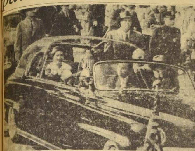
La Séptima Flota de EE. UU. lista para zarpar al Medio Oriente.

CON LA SEPTIMA ESCUADRA NOROCCIDENTAL EN EL PACIFICO, 21 (UP). — La poderosa Séptima Flota de EE. UU. lista para zarpar al Medio Oriente. La Séptima Flota de EE. UU. lista para zarpar al Medio Oriente. La Séptima Flota de EE. UU. lista para zarpar al Medio Oriente.