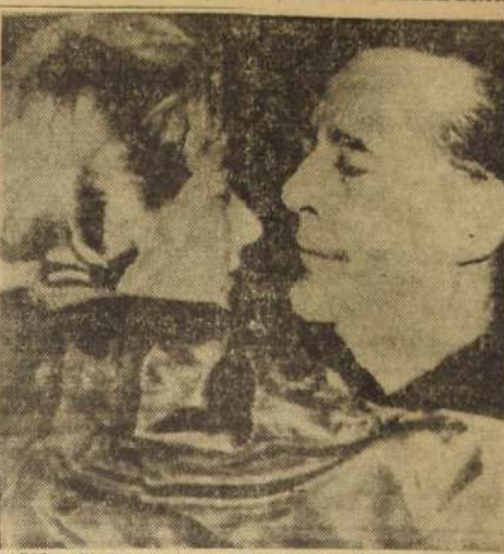
El director de cine Roberto Rossellini en un momento de su vida.

Se espera un paro completo de los obreros frigoríficos, me. Se espera un paro completo de los obreros frigoríficos, me.