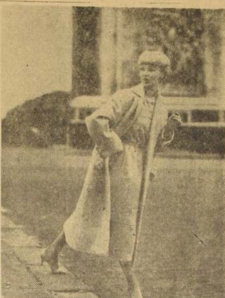
ELEGANCIA FEMENINA. — El vestido "Robe de chambre" y el abrigo "Couture" son los componentes del conjunto que representa nuestra foto y que pertenecen a la colección de "Prêt à porter" de la Casa Syma, de París, para la primavera-verano 1957. Se eligió para su confección un género de lana clara jaspeada. La bolita de Marie Christiane y los guantes Neyret acompañan la tenida.