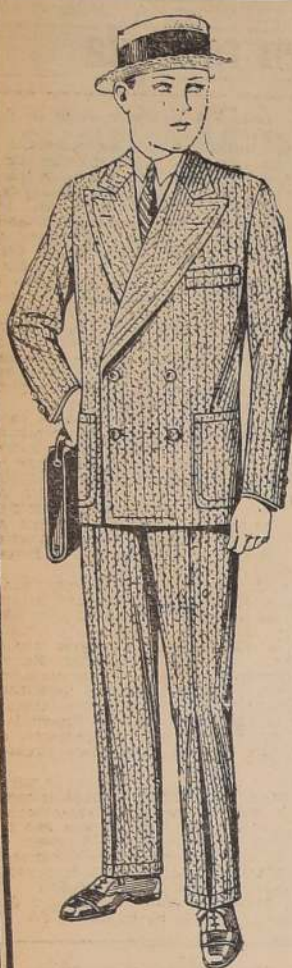
TRAJE modelo cruzado o derecho, de sarga azul y colores de fantasía, de 13 a 17 años,