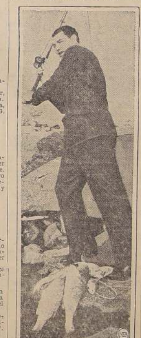
Se colocaban ante sus demoliciones punios. Aquí se ve al ex-campeón mundial con varias de sus víctimas, en la costa de Galveston, Texas. Se habla con insistencia que el ex-

Por lo visto, Jack Dempsey, como pescador, constituye para los peses el mismo mortal peligro que cuando era boxeador constituía para cuantos