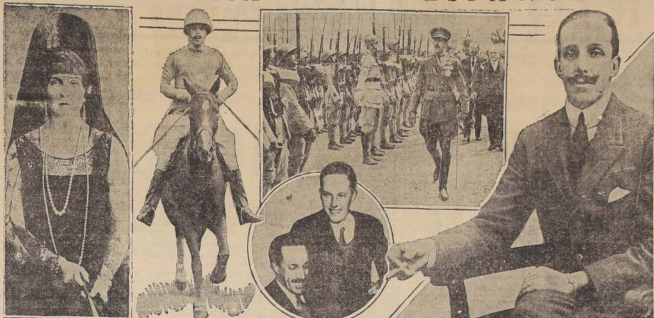
Damos aquí algunas fotografías tomadas recientemente de algunos de los miembros de la familia real española. A la izquierda se ve a la Reina Victoria Eugenia, y a su lado el Rey Alfonso, después de una partida de polo, uno de sus deportes favoritos. En el centro, arriba, aparece el Monarca durante una revista a las tropas de Madrid. Abajo se le ve acompañado del Heredero del Trono, el Príncipe de Asturias, en una escena íntima. A la derecha, una fotografía del Soberano tomada en el Palacio Real.