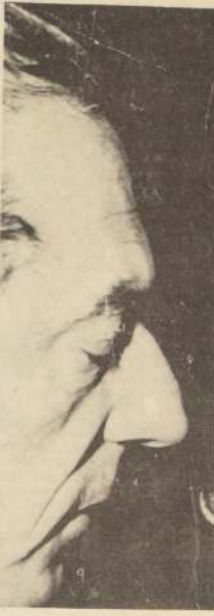
Canciller Chileno: Gabriel Valdés Subercaseaux

Reafirmaron su beneplácito al buen suceso de la primera etapa de la reunión a nivel técnico de CECLA, que afirmó y reafirmó el principio de la soberanía económica de América Latina y conviniere en propiciar en las próximas reuniones de la misma Comisión, planes de acción concretos y dinámicos que, con los neces-