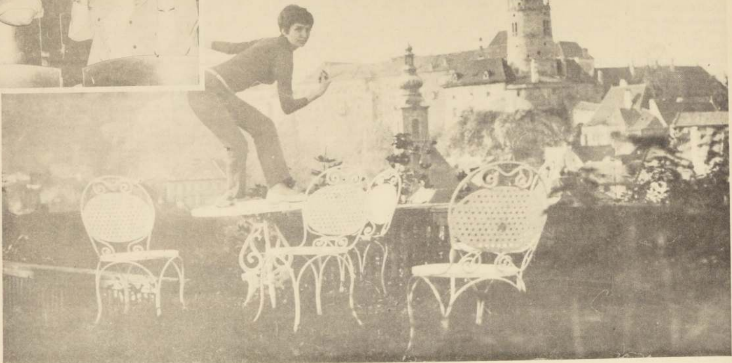
Bailarina de "La Linterna Mágica".

Encantados se encuentran en Chile, los artistas y técnicos de "La Linterna Mágica". Todos ellos se hospedan en la Carlton House, edificio de departamentos situado entre Miraflores y McIver, a dos cuadras de la Alameda. Los almuerzos los hacen en los restaurantes del centro. Gocan de los mariscos chilenos: las centollas, langostas, almejas, locos.