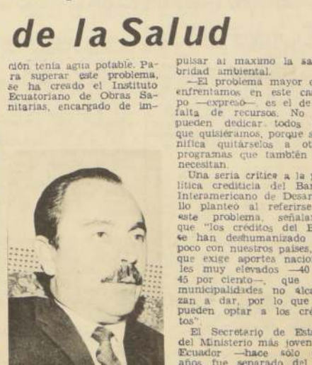
Francisco Parra Gil, Ministro de Salud del Ecuador.