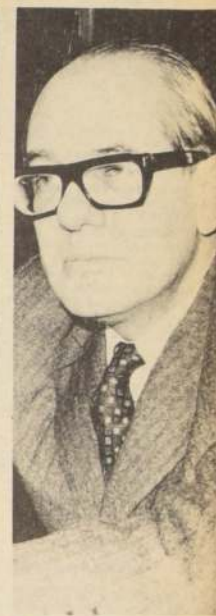
Canciller Colombiano: Alfonso López Michelsen