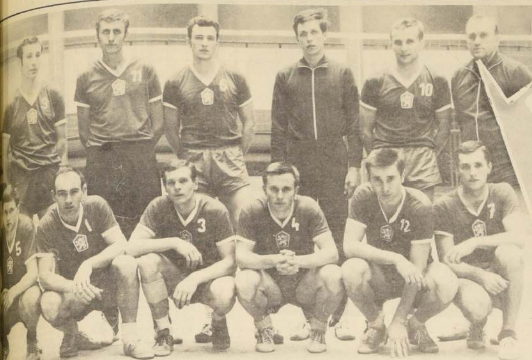
El seleccionado checo, primer rival del sexteto chileno, causaron una inmejorable impresión en su entrenamiento final.