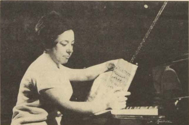
La Extraordinaria pianista española, Alicia Larrocha que actuará mañana junto a la Orquesta Filarmónica.