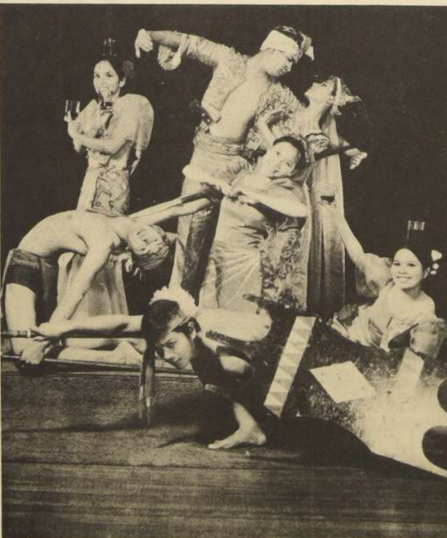
El Ballet Filipinense. Todo un número de atracción en la programación de este año en nuestro medio.

En la parte instrumental intervienen: Guitarra, tiple y guitarrón. Este último es una guitarra con un orden de cuerdas distinto a lo tradicional. "Los Carreteros" se presentan con trajes típicos que se ajustan a la época y sus programas tienen un carácter eminentemente cultural, ya que están vinculados a la historia y costumbres del Uruguay.