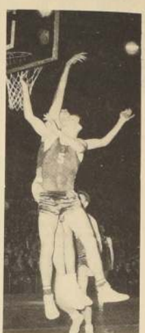
MODESTAS PAULASKAS. Los uruguayos no pudieron detener su lanzamiento de balón en sus fulminantes entradas. Rusia barrió con Uruguay.

Es menester destacar que los latinoamericanos abrieron el marcador, al comenzar el juego pero en pocos segundos los soviéticos lograron empatar y pasar a la delantera con una ventaja que paulatinamente aumentó hasta llegar a proporciones nada despreciables al final del primer tiempo, y espectacular al término del partido. Al 15 el puntaje era de 15-5, a los 10 de 25-13 y cinco minutos más tarde de 37-20. El primer tiempo, como antedi-