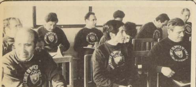
UN ASPECTO DEL CURSO DE CAPACITACIÓN para Entrenadores de Ciclismo, iniciado el lunes con el auspicio del Comité Olímpico de Chile y la Federación Nacional de este deporte. En total, asisten a estos cursos 18 técnicos de diferentes puntos del país.

¿Qué hay detrás de todo el problema de las programaciones y que han arrastrado a la actual temporada a una pobreza más extrema que la del año pasado a la misma altura? Simplemente que no se han