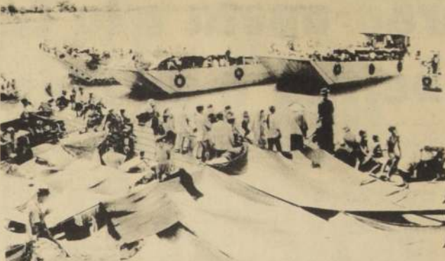
Barcas de desembarco de Vietnam del Sur aparecen rescatando a refugiados sudvietnamitas en territorio camboyano para ser repatriados con los enseres que lograron llevar consigo (Radiofoto UPI).

Una de las nuevas disputas no dirigidas contra el gobierno no los impresores de diarios abandonaron sus tareas por una semana, en el paro más prolongado que se registra en ese gremio desde el fin de la segunda guerra mundial. El más largo que se había realizado hasta ahora fue de cinco días y siguió a una tentativa de asesinato del difunto líder comunista Palmiro Togliatti.