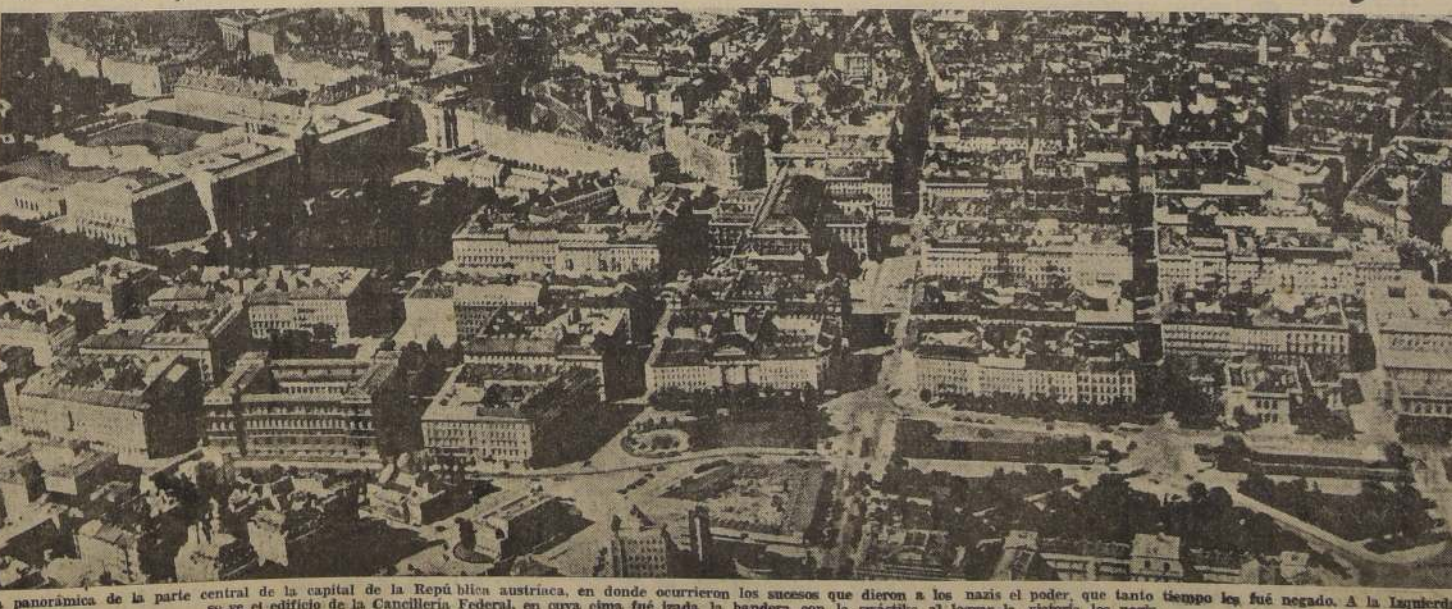
Vista panorámica de la parte central de la capital de la República austriaca, en donde ocurrieron los sucesos que dieron a los nazis el poder, que tanto tiempo les fué negado. A la izquierda se ve el edificio de la Cancillería Federal, en cuya cima fué izada la bandera con la swástica al lograr la victoria los nazis.