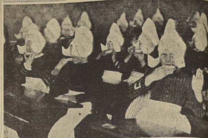
Los alumnos de las escuelas de los Países Bajos acaban de recibir un regalo para ellos muy apreciable, consistente en setenta mil galletas de anís, que pueden ser comidas durante las clases.