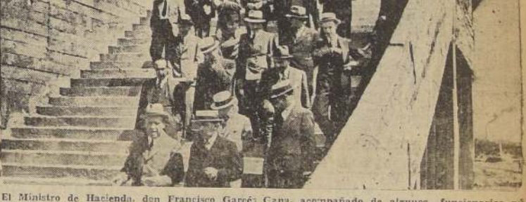
El ministro de Hacienda, don Francisco Garcés Gana, acompañado de algunos funcionarios públicos y obreros de las obras del Estadio Nacional. Un aspecto de las tribunas en construcción. Los Ministros de Estado y comitiva al retirarse después de su visita al Estadio Nacional

Instituto de Educación Física; pabellón para box, lucha y esgrima; teatro al aire libre; gimnasio; gran sala de proyección; correos y telegrafos; habitaciones para deportistas; restaurant; canchas de entrenamiento para fútbol, atletismo, basketball, tenis, etc.