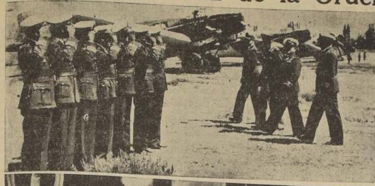
Las insignias les fueron impuestas en la Cancillería

La Misión Militar se trasladará hoy día a Valparaíso