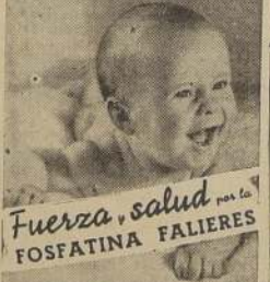
Fuerza salud por la FOSLATINA FALIERES