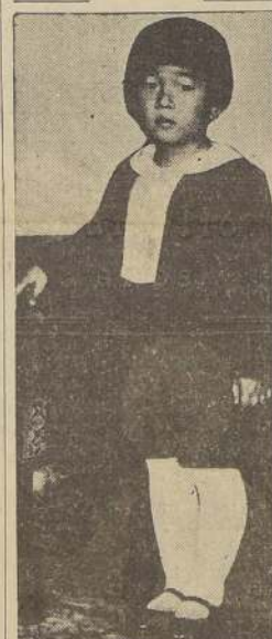
El príncipe de la Corona, Akito Tsugu, hijo del emperador japonés, que celebró recientemente su cuarto