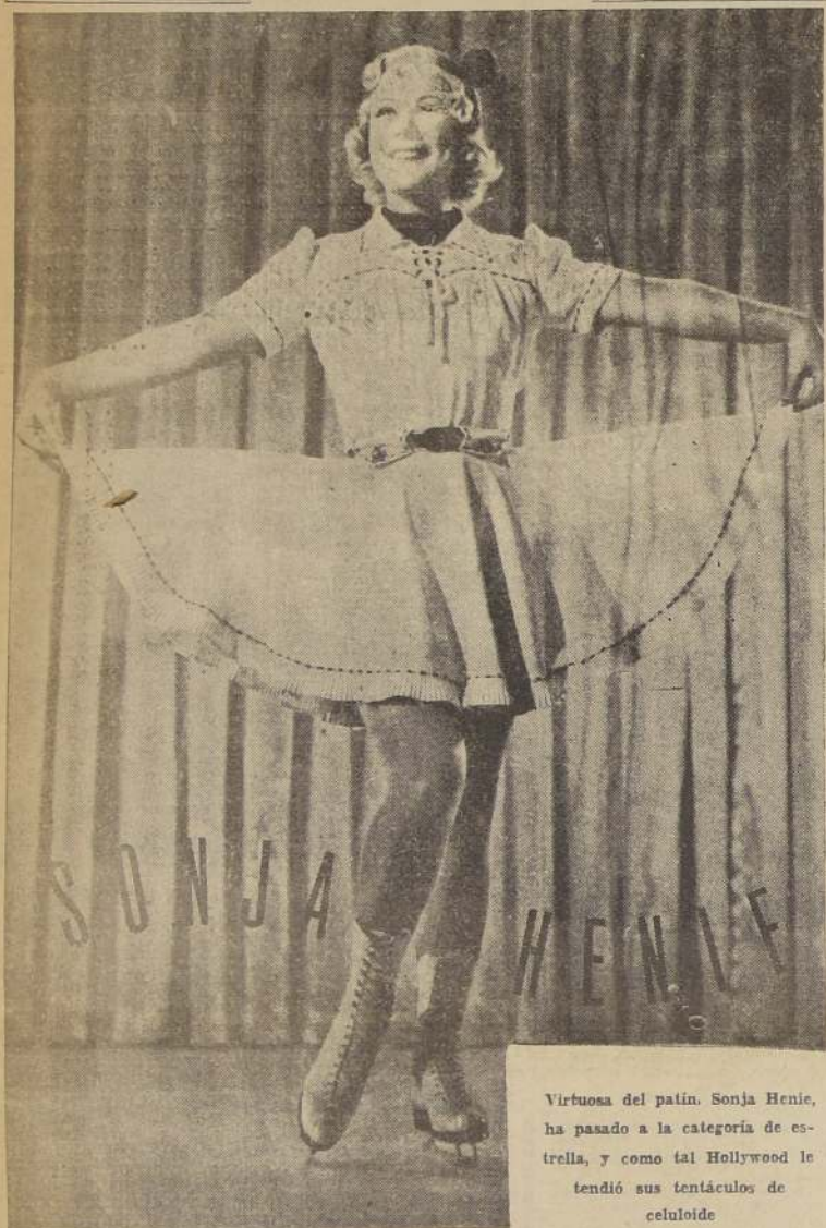
Virtuosa del patin, Sonja Henie, ha pasado a la categoría de estrella, y como tal Hollywood le tendió sus tentáculos de celuloide.