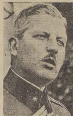
Canciller Schuschnigg que renunció ayer