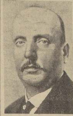
Presidente de la República, Herr Miklas

Hubo desórdenes en todo el país. — Los elementos nazis se lanzaron a las calles y tuvieron sangrientos choques con los anti-nazis. — A las 22.10 horas la swástica ondeaba en la Cancillería