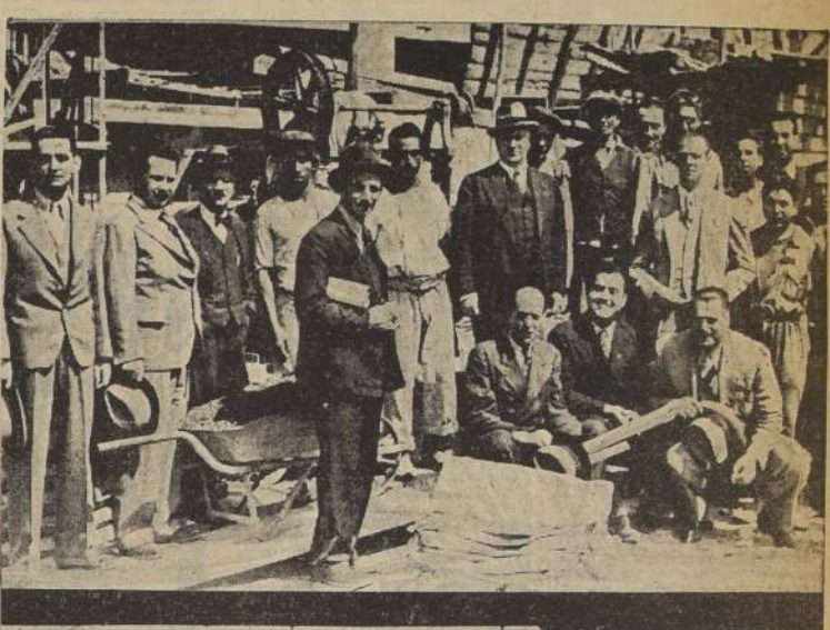
El ministro de Hacienda, don Francisco Garcés Gana, acompañado de algunos funcionarios públicos y obreros de las obras del Estadio Nacional. Un aspecto de las tribunas en construcción. Los Ministros de Estado y comitiva al retirarse después de su visita al Estadio Nacional

Ha sido altamente honroso para la institución que manda al recibir en esta oportunidad la visita de tan ilustres huéspedes, y poder testimoniar, mediante este sencillo homenaje, el cariño con que los chilenos corresponden al ejército brasileño. Pero hay una razón muy especial, S. S., para que