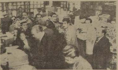
Una de las secciones de Falabella es invadida por el público

actual Liquidación de es el acontecimiento economía más notable últimos años de una organización comercial — 8.