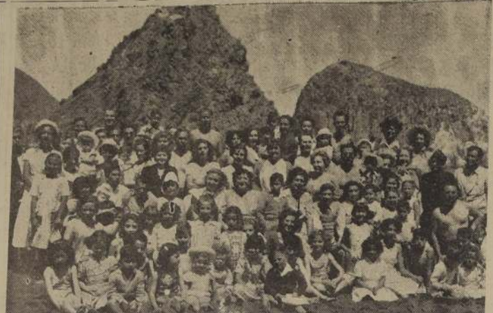
EN LAS PLAYAS DE CONSTITUCION. El balneario se anima de nuevo con el bullicio de cientos de veraneantes que buscan la grata acogida de sus playas durante estos días de tórrido calor. He aquí un grupo numeroso de bañistas en el mar por el lente de LA NACION. — JOSE CARRASCO, Corresponsal.