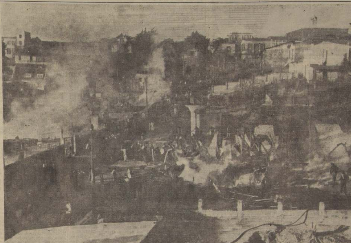
DESOLACION Y TRAGEDIA. — Un aspecto de la calle Olea, que fué arrasada en sus dos costados por el voraz incendio que ayer consumió trece casas del vecino balneario de Cartagena. Esta fotografía tomada a las 18 horas, sólo muestra restos y ruinas, mientras el humo aún surge de los escombros. 260 personas resultaron damnificadas.