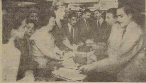
Damas adquiriendo sus mercaderías en la Sección Niños