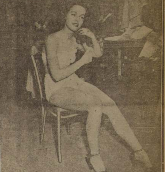
De espectadora, esta hermosa candidata se ha transformado en actriz.