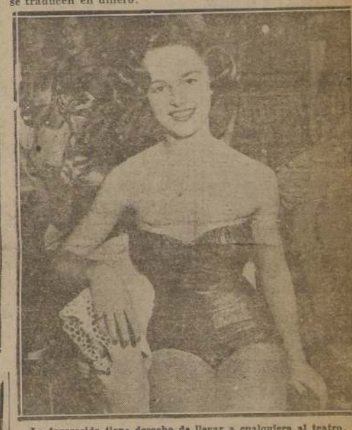
La favorecida tiene derecho de llevar a cualquiera al teatro. De seguro no le han de faltar candidatos...

Esto no significa más que seis asientos ocupados durante el año y, aún más, sólo una vez por semana, pues las favorecidas no van a ir todos los días al cine. En cambio, es una gran publicidad para la sala. Las ideas acertadas se traducen en dinero.