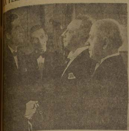
Merle Oberon saluda a Arturo Rubinstein, uno de los más grandes pianistas del mundo, y a Eugene Ormandy, el más prestigioso director de orquesta del mundo.

MERLE OBERON APLAUDIREMOS EN LA PELICULA "MI CORAZON TE GUIA"