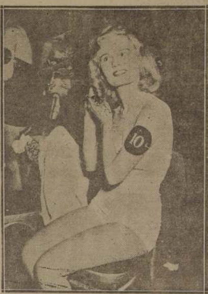
¿ES ESTA UNA COMPETIDORA? Si y también una espectadora.

COMPLETOS. CON COLCHON Y ALMOHADA. CON FECCION DE PRIMERA. SOLICITE MUESTRAS DE TELAS Y COLORES. Pedidos provincias contra reembolso. SAN DIEGO 1749-A. CASILLA 852-TEL 5417