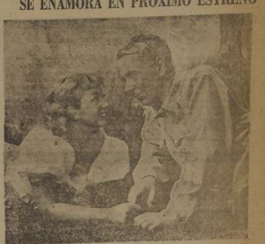
Una escena en que aparece la bella y adorable Ann Sothern, junto a Alexander Knox, en la producción de la RKO Radio, "El juez se enamora", que el Teatro Cervantes estrenará mañana.

La adorable Ann Sothern, considerada como una de las más lindas estrellas de la pantalla, se presentará mañana en el Teatro Cervantes en la producción "El juez se enamora". Esta película es una comedia alegre y sentimental, a la vez. Es la historia de un magistrado que, acosado por las preocupaciones hogareñas, decide un día abandonar su casa, para vivir libremente. Así conoce a la adorable Ann Sothern, con quien convive el más dulce idilio.