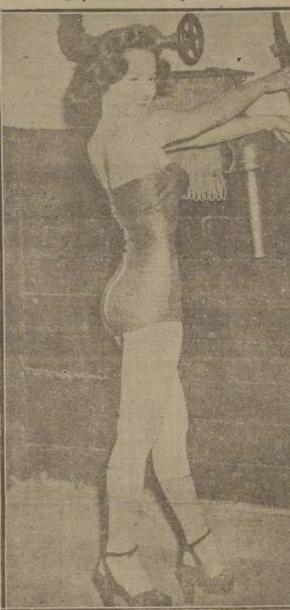
UNA MODELO CAUTIVADORA

Hay muchas otras como ellas entre la muchedumbre.