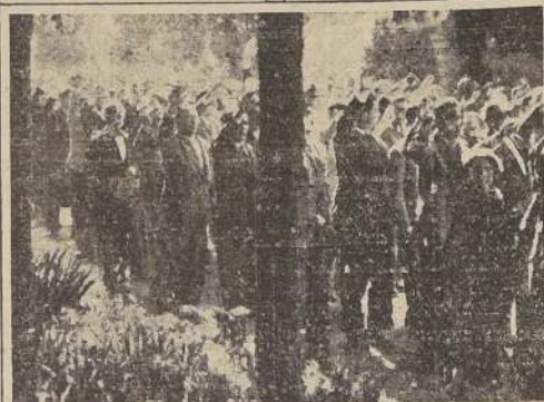
Acto de la inhumación de los restos del Sr. Calvo Sotelo