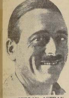
JOSE MILLAN ASTRAY

CHERBURGO, 23. — (U. P.) — El "Oklahoma" adelantó su partida hacia Bilbao, saliendo a las 15.15.