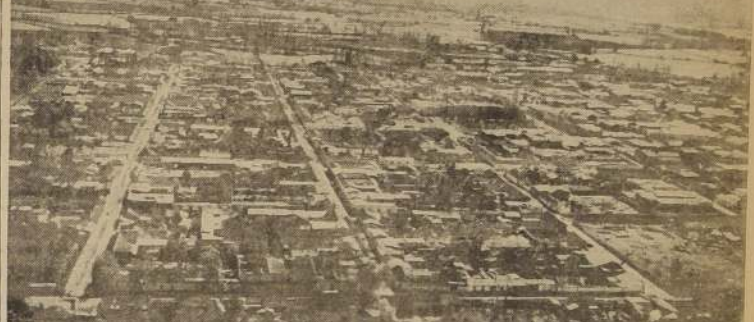
Vista panorámica de la ciudad de Los Andes.

rocarriles del Estado, comprendiendo que no pueden desvincular sus intereses de las conveniencias de los pueblos que les dan vida y movimiento, reaccionarán contra esta absurda posición, reconsiderará, en justa y funesta medida, y de la-