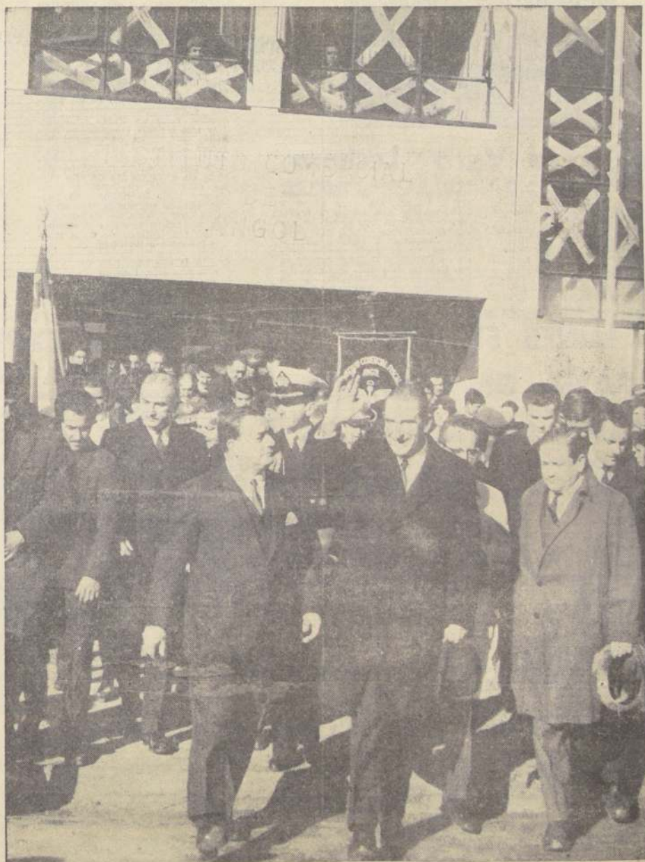
Calurosa recepción tributó la provincia de Malleco al Presidente Frei. La concentración realizada en el Teatro Rex de la ciudad de Angol sirvió para demostrar el afecto popular que rodea al Primer Mandatario. El grabado registra el instante en que hace abandono del Instituto Comercial N° 2 de la capital de esa provincia, acompañado por el Intendente, Abner Castillo Venegas, Ministros de Estado, parlamentarios de la zona y autoridades regionales.