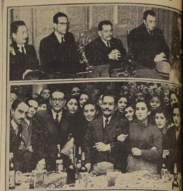
Durante la visita del Excmo. señor Aguirre Cerda a los radicales de Quinta Normal

A mediodía de ayer, tuvo lugar, en el Club Radical de la Comuna de Quinta Normal, la sesión solemne de la Asamblea Radical, en honor de S. E. el Presidente de la República.