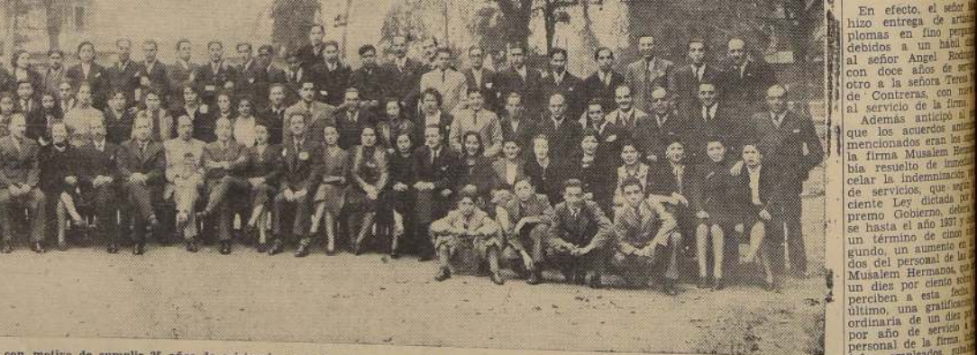
Asistentes a la manifestación de la firma Musalem Hermanos, con motivo de cumplir 25 años de existencia, y en la que aparecen los propietarios junto a su numeroso personal de empleados.

trabajaba a sus serviciales y dignísimos jefes, empleados y colaboradores en general. Nada más hermoso — dijo en una parte de su hermosa improvisación — que contemplar, y al