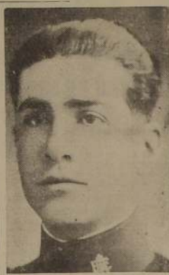
La Comandancia General de la Cuartelada ha dispuesto que un Batallón del Regimiento de Infantería "Bulín", con su Estándarte y Banda Instrumental, se encuentre formado en la plaza de la Comandancia, a fin de rendirle los honores de ordenanza.