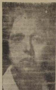
Lady Orde, esposa del Embajador Sir Charles Orde.