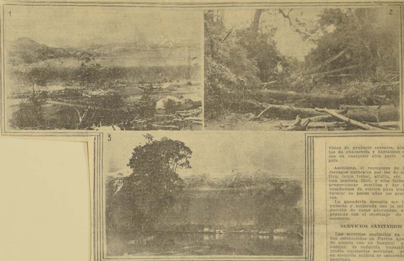
1. Vista del Fuerte Aysen. — 2. Un rincón pintoresco cerca del Fuerte (Río Los Pavos). — 3. Una casa de un colono en Coihaique.

PUBLICA. --- CUERPO DE CARABINEROS. --- REGISTRO CIVIL Y MILITAR