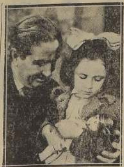
continuará exhibiéndose durante toda la semana en la pantalla del Teatro Santiago