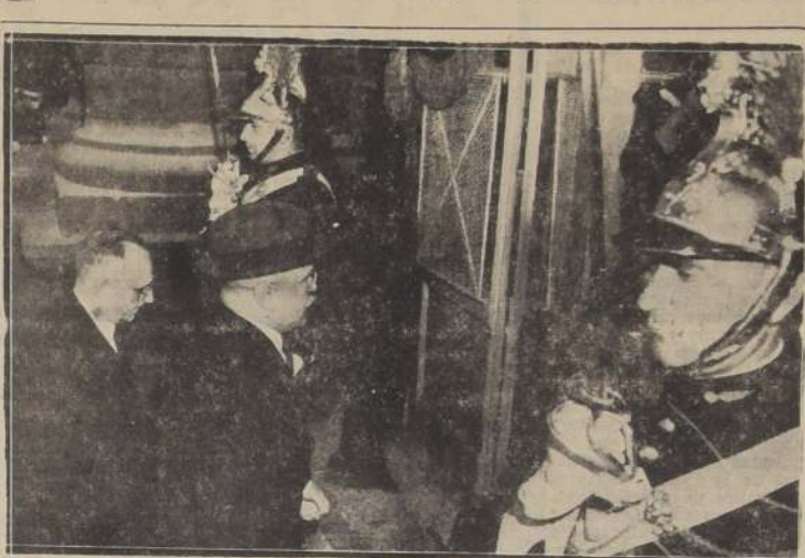
Vyacheslav Molotov entra al palacio de Luxemburgo, sede de la Conferencia de Paz, mientras la tradicional Guardia Republicana presenta armas en su honor