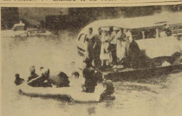
DETROIT.- Lluvias torrenciales cubrieron las calles de esta ciudad con un metro de altura de agua obligando a las personas que se encontraban en diversos vehículos a abandonarlos utilizando botes de goma. (Radiofoto UNITED PRESS).

Unión Soviética, al haberse presentado un "ultimátum" sobre la limitación de las pruebas nucleares, que "ninguna nación que se respete puede aceptar".