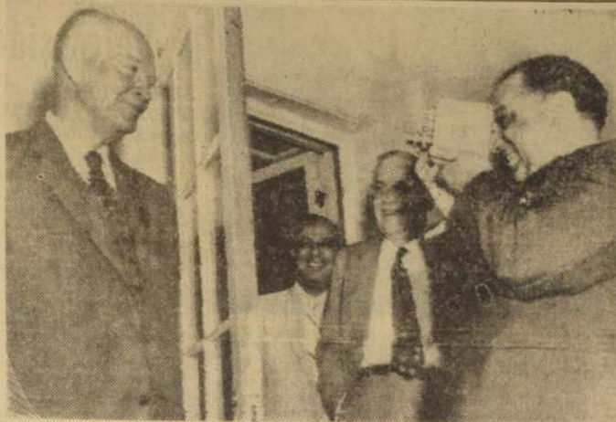
WASHINGTON.—El Primer Ministro de Pakistán, de visita en los Estados Unidos, señor Suhrawardy, toma una película del Presidente Eisenhower durante su visita a la Casa Blanca.

Ghulam Ali Ailam, presidente del Consejo Supremo del Aga Khan en Pakistán, anunció un período de duelo de tres días por parte de los 30.000 ismaelitas de Karachi. Durante ese plazo los ismaelitas suspendieron todos sus negocios. La comunidad ismaelita ofreció hoy oraciones en el parque del Aga Khan, después de sus acostumbradas oraciones matutinas.