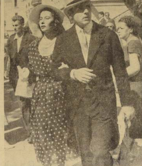
EL HIJO MENOR DEL AGA KHAN. — Vemos aquí al Príncipe Sa- drudin, hijo menor del Aga Khan, con su prometida la ex model- lo londinense Nina Grey, fotografiados el 30 de junio en el Hipódromo de Longchamp al correrse el Grand Prix de Paris. La atención de la concurrencia se concentró en la interesante pareja, que estuvo sometida al incesante "hombardeo" de gran número de fotógrafos. La boda debía efectuarse el 15 del actual; pero, con motivo del fallecimiento del Aga Khan, ha sido aplazada "indefinidamente".