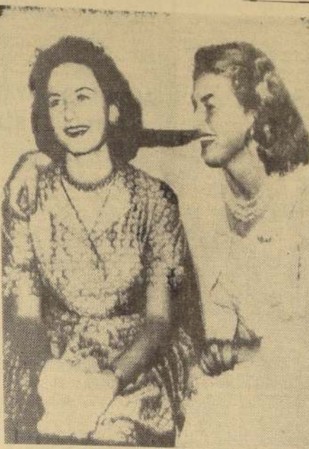
ROMA.— Ingrid Bergman recibió ayer la visita de su hija, Jenny Lindström, de su primer matrimonio. Esta es la primera vez que Jenny visita a su madre, después de que Ingrid abandonara a su padre y se casara con Roberto Rossellini.