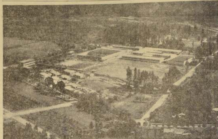
Rodeada de un panorama magnífico, se levanta en Peñaflores la planta de producción de Bata. En el primer plano puede verse la Escuela Industrial, la moderna población para su personal que cuenta con un pequeño estadio y, al fondo, las plantas de producción. La fabricación en serie del calzado ha permitido que Bata se transforme en un elemento regulador de los precios.

Dentro de Bata, no son simplemente las máquinas las que hacen el calzado, sino la producción en masa. Cada "batamán" sabe exactamente cuáles son sus posibilidades y responsabilidades y se ajusta perfectamente a ellas.