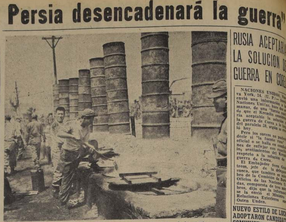
En esta foto vemos a prisioneros de guerra preparando la comida en una de las muchas cocinas del campo de concentración de Pusan. Comida de su elección más la comida del día aumentan la cantidad de calorías en sus dietas.

La sesión se levantó a los 10 minutos de iniciarse, cuando el delegado soviético Viceministro de Relaciones Exteriores, Andrei Gromyko, manifestó que Gran Bretaña estaba dispuesta a aceptar "en principio", la nacionalización, pero sólo si el Gobierno iraní accedía a negociar una solución justa del problema. Esas esferas dijeron que para que Gran Bretaña acepte la nacionalización, sería necesario que se realizaran, libremente, negociaciones entre ambos Gobiernos, sin que el Gobierno de Irán tomara medidas unilaterales al poner en vigor las disposiciones legales mediante las cuales se nacionalizó la Anglo-Iranian Oil Company.