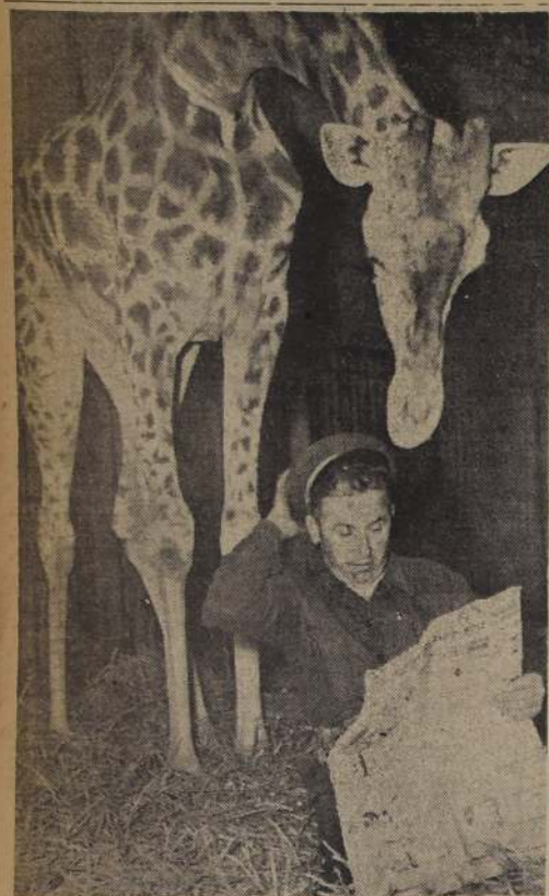
PARIS. — Mirando las noticias. La foto que aquí vemos da una demostración práctica de la verdadera técnica de leer el diario del compañero de viaje en el tranvía. En el zoológico de Vincennes, cerca de París, una jirafa acostumbrada a la vida mundana no tiene vergüenza de echar un vistazo a las noticias que lee su cuidador en un vespertino parisien.