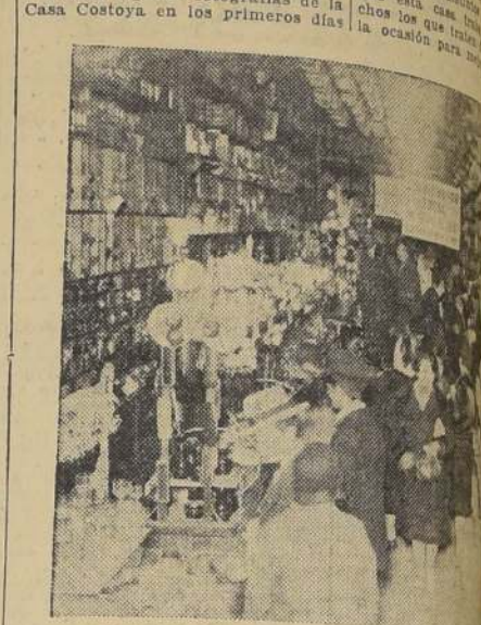
LA SECCION MENAJE, A LAS 2.30 DE LA TARDE