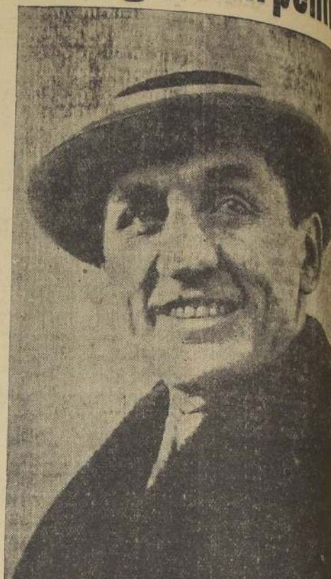
George Carpentier Mi record

bustible a la hoguera. Descamps, también, resultó tan buen periodista como hombre de box. Antes ya había sido empresario teatral y conocía todos los resortes de la publicidad. Los cronistas no tardaron en escribir leyendas sobre el diligente empresario, relatando sus aventuras y las acciones de guerra de Carpentier. Se refirió, por ejemplo, cómo Descamps, cuando era hombre de circo, hipnotista y prestidigitador, después de sacar muchos conejos de un sombrero, improvisó una exhibición de box. Esto ocurría en el distrito número de Lens, donde Carpentier era un espectador. Invitó a subir al palco escénico, Descamps descubrió al futuro boxeador. El muchacho peleó tan bien que nunca más el empresario lo dejó de su mano. Nunca más, tampoco, Descamps tuvo ocasión de sacar más conejos de los sombreros. ¿No era todo esto una publicidad de perlas?