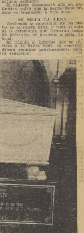
Labor de la Comisión de Reforma de las leyes sociales

dois de suero curativo de la escarlatina, para ser enviado a Santiago a la mayor brevedad. Enviado recital ayer tarde SEÑORAS LO APLAUDIO