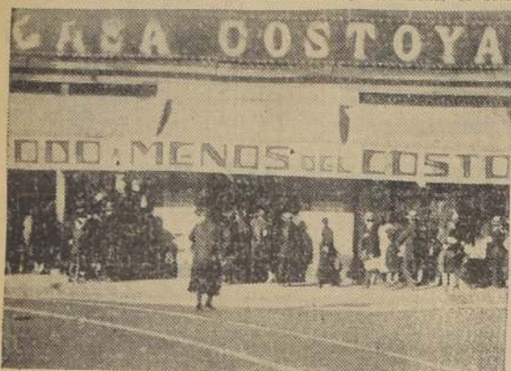
PUBLICO FRENTE A LA CASA COSTOYA, ESPERANDO SU TURNO PARA ENTRAR.

Damos algunas fotografías de la Casa Costoya en los primeros días