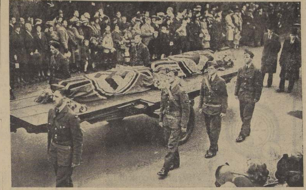
Los restos de dos aviadores alemanes que perecieron durante el reciente raid en el Firth of Forth, Escocia, en el momento de ser trasladados al cementerio en Porto Bello, cerca de Edimburgo. La bandera nazi cubre los dos ataúdes. Muchos oficiales y soldados de la Real Fuerza Aérea tomaron parte en la ceremonia. (Por correo aéreo, especial para "LA NACION". Aprobada por la Censura Británica).

LA GUERRA EN LOS MARES NUEVA YORK, 3. — (U. P.) — Oficialmente se anuncia que el Almirantazgo noruego comunicó que el vapor "City of Flint" se hallaba en libertad y que podía zarpar cuando quisiera. COPENHAGUE, 3. — (U. P.) — De fuente digna de crédito de Haugesund se sabe que la tripulación alemana del "City of Flint" fue internada en dicho puerto, según se anuncia, por lo que violó por segunda vez la neutralidad de Noruega. La tripulación norteamericana volvió a tomar el mando del barco, al decir de la misma fuente, la que asegura que se autorizó a los norteamericanos para que siguiesen viaje por aguas territoriales noruegas. POR QUE SE INTERNO A LOS ALEMANES ESTOCOLMO, 3. — (U. P.) — El Almirantazgo noruego reveló que la tripulación alemana de presa del vapor norteamericano "City of Flint" fue internada. Se tomó esa medida en vista de que dicha tripulación insistió en detenerse en Haugesund sin contar con el permiso del Almirantazgo. El Almirantazgo dice que la tripulación alemana del "City of Flint" no tenía excusa válida para hacer escala en Haugesund, porque el barco era escol-