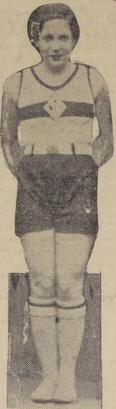
Cora Bozo, que también con-