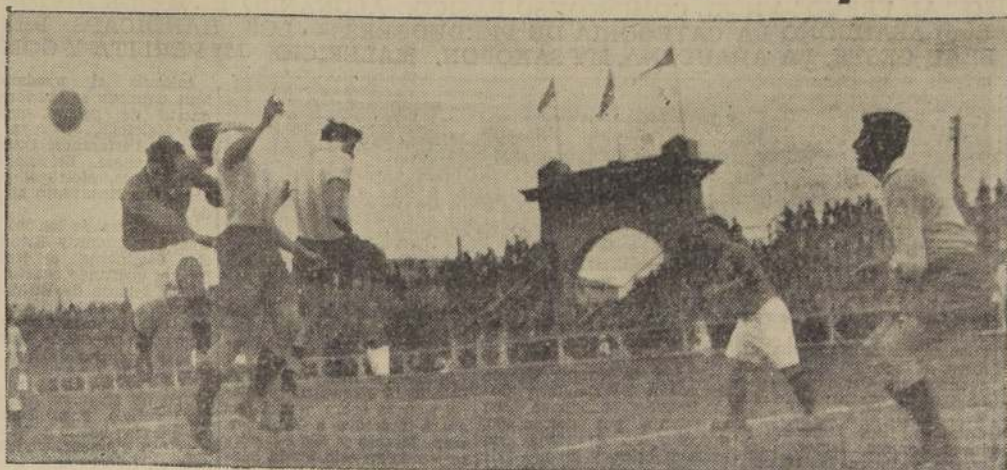
Un ataque de Avilés muy bien defendido por la defensa del Magallanes

El partido terminó con un score de 3 a 3. Los jugadores de Audax mostraron una gran mejora en su juego, especialmente en la defensa, que logró detener los ataques del Magallanes.