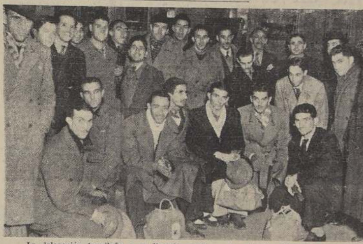
La delegación brasileña a su llegada anoche a la estación Mapocho

cancelar al gran pueblo brasileño. Por estas circunstancias, pues, esbozadas así, "arabes modo" es que pensamos que este match va a hacer época en la historia de nuestro más popular deporte.