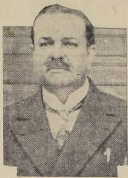
Don Salomón Ascui, Gobernador de Victoria.

Proyecta, además, la Municipalidad de Victoria construir un mercado modelo y hacer la pavimentación definitiva de treinta cuadras de calles.