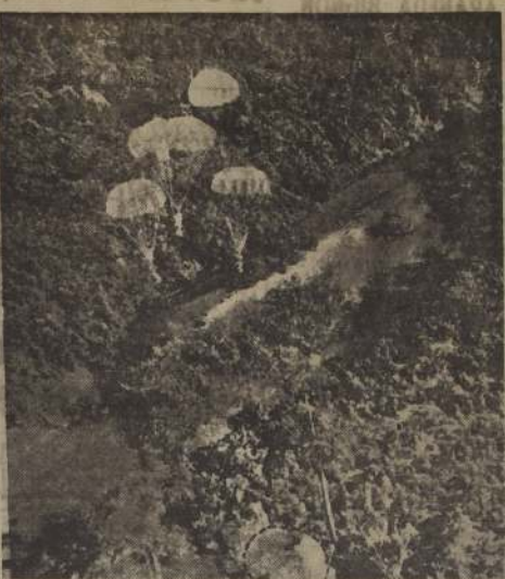
Aviones de la Real Fuerza Aérea de Gran Bretaña, dejan caer abastecimientos en un claro de la selva del norte de Malaya, en donde se hallan operando las tropas inglesas.

El correspondiente de la United Press, Joe Quinn, informó desde