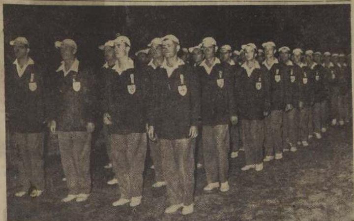
DESFILE EL EQUIPO CHILENO EN JUEGOS PANAMERICANOS.— La numerosa delegación que ha enviado Chile, desfila la noche de la inauguración de los Primeros Juegos Olímpicos Panamericanos en Buenos Aires la noche del domingo último.