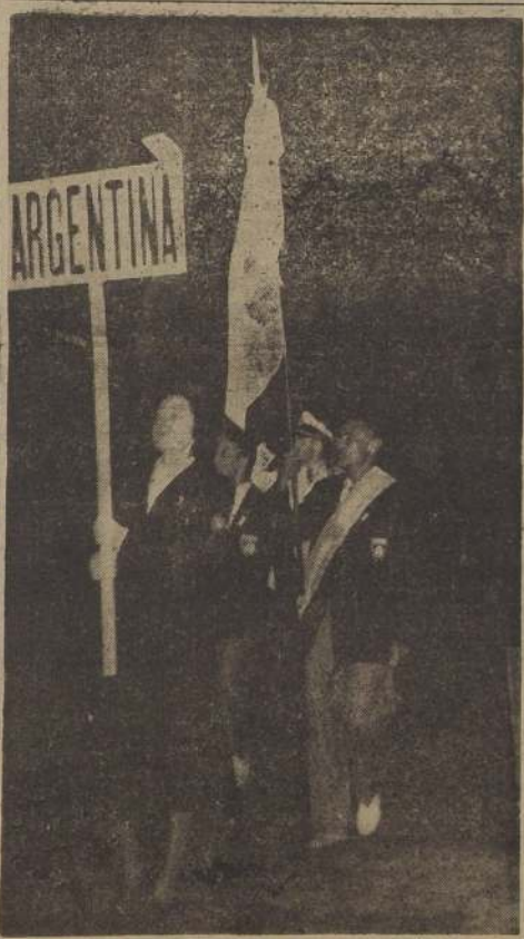
ESTANDARTE DE ARGENTINA. — Cerró el desfile inaugural de los Juegos Panamericanos, el numeroso conjunto del país organizador. Condujo el estandarte Delfo Cabrera, ganador olímpico de la maratón de Londres.

"QUE CADA UNO SEPA GANAR Y PERDER CON HONRA"