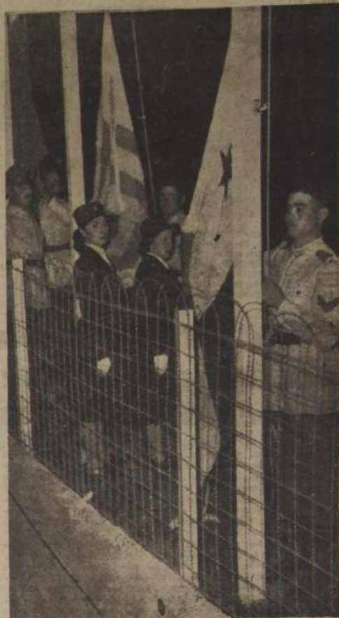
IZAN LAS BANDERAS DE LAS 21 NACIONES.— Buenos Aires.— Emocionante momento en que se izan las 21 banderas de los 21 países participantes en los Primeros Juegos Olímpicos Panamericanos, inaugurados la noche del domingo en Buenos Aires, en presencia del Presidente de la República Argentina.— (Foto ACME).

El cuartel de las Fuerzas Aéreas de las Naciones Unidas informó que el transporte aéreo