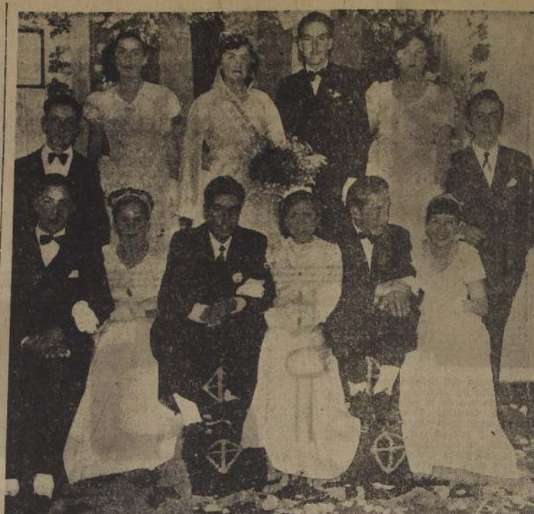
REINA DEL MUTUALISMO EN LA UNION.— Su Majestad Matilde I, rodeada de su Corte de Honor, que presidió las festividades mutualistas de esta ciudad. La gentil soberana practicó visitas a los enfermos del Hospital y a los reos de la Cárcel, llevándose las simpatías de su juventud, y haciéndoles obsequios.