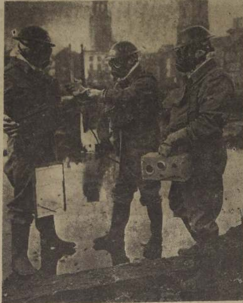
El primer ejercicio de defensa civil contra los bombardeos atómicos se efectuó por primera vez en Bristol, Inglaterra, entre el 10 y el 11 de febrero en curso. En estos ejercicios conocidos con el nombre de Medusa participaron 1.300 soldados, los cuales tomaron parte en operaciones de rescate, desalojamiento de escombros, primeros auxilios, lucha contra el fuego. En el grabado aparece una unidad técnica, usando un aparato para registrar las radiaciones. (The Illustrated London News).

Entre los asistentes, se cuentan muchos altos funcionarios navales argentinos entre ellos, el Ministro de Marina.