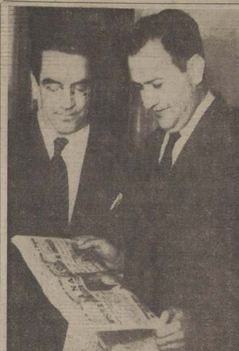
El presidente de la Cámara, doctor Raúl Brañes, conversa con el diputado radical señor Luis Bossay, en espera de la sesión en que se votó el proyecto económico.

Brillantes, figura y grupos porcelana, objetos de arte, boletos empuño. HUFANOS 1151 (Agencia Lotería) FONOS: 89830-61641 Voy a domicilio