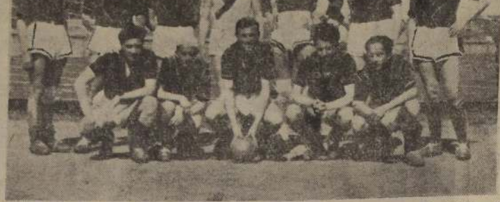
El Club Deportivo Estudiantil se clasificó campeón invitado en la última temporada futbolística, de la ciudad de Castro. He aquí al cuadro vencedor de la jornada oficial que nos ocupa.

CONCEPCION, 10. — Activamente prosiguen las diligencias de la Sociedad Agrícola del Sur, tendientes a la adecuada preparación de la Exposición del Centenario de Concepción que tendrá el carácter de nacional. Se están construyendo los pabellones, se mandaron a editar los programas y reglamentos del torneo y se estudia un interesante plan de premios que desalentará al participante. En cambio, los funcionarios de la exposición cuentan con el máximo de presentaciones en los más variados rubros. La distribución interna de la Exposición será la siguiente: Sección Industrial, contempla los rubros que se indican a) maquinaria agrícola; b) maquinaria en general; c) importadas y nacionales; d) fábricas de paños, cerámica, vidrio, metales, molinería, apicultura y cunicultura. Sección Comercial: minorista y mayorista. Gran demanda de solicitudes para participar en cualquiera de los aspectos indicados pueden escribirse a: N.º 7 Concepción, (PRADENAS, Corresponsal).