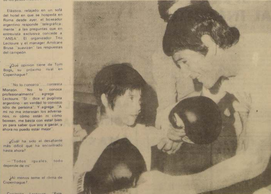
Carlos Monzón: no piensa dejar la corona mundial.

Al despedirse alza un poco la gorra, extiende la mano y agradece por millones una vez a quien le desea un nuevo triunfo con un latido a gritos.