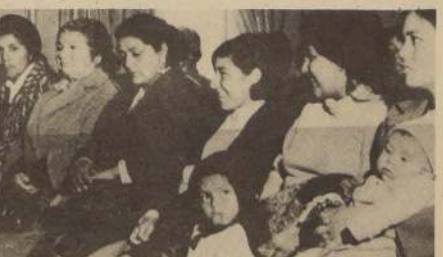
ALGUNAS de las mujeres porteñas que vinieron a apoyar al Comodoro Presidente.

forma de diálogo directo con el Ministro Matte, se acordó la creación, en Valparaíso, de la Oficina Regional del Poblador, organismo destinado a centralizar la acción que vaya en beneficio de los habitantes de los campamentos y poblaciones, y en el que tendrán especial participación, como gestores y ejecutores, los propios pobladores.