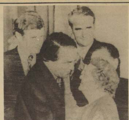
WASHINGTON. Una anciana de 90 años besa al candidato a la Vicepresidencia de la Nación, Sargent Shriver, cuando su nominación en la fórmula que encabeza el Senador McGovern para Presidente fue aceptada por la reunión del Comité Central del Partido Demócrata, el pasado miércoles.

La controversia se originó a raíz de una decisión gubernamental designando al idioma Sindh como lengua oficial de la provincia de Sindh. Los residentes de habla urdu provocaron desde entonces violentas revueltas enfrentando a la policía y al ejército, al cabo de las cuales hubo 18 muertos, según la estimación oficial.