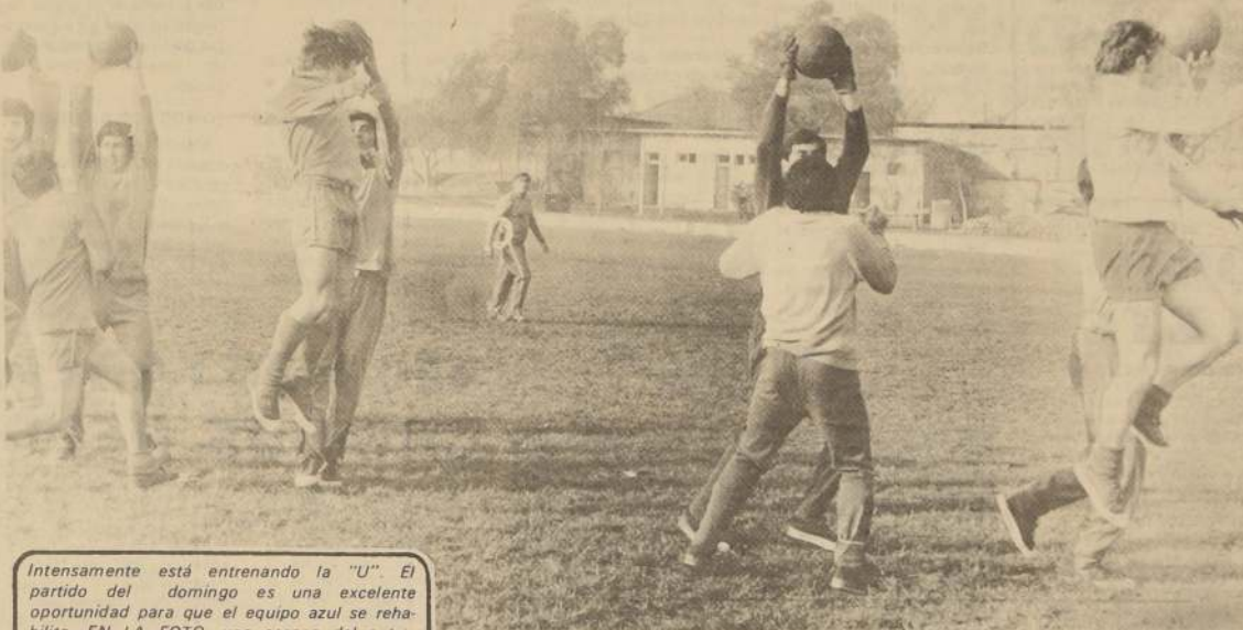
Intensamente está entrenando la "U". El partido del domingo es una excelente oportunidad para que el equipo azul se rehabilite. EN LA FOTO, una escena del entrenamiento de ayer.