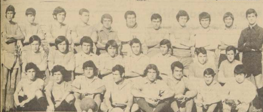
Plantel Superior de San Antonio Unido Líder del Campeonato de Ascenso.

—¿Planes? —"Los únicos planes que tenemos son la adquisición de un terreno para construir nuestro estadio. Ya estamos haciendo los contactos con un señor de la zona. Si lo adquirimos, 'Canchales para Chile' deberá hacer el resto, y en esa campaña nos enfriaremos todos. Como casi todos los dirigentes nuestros son gremialistas, estas cosas nos resultan pequeñas y entretenidas. Fijese, en este momento hay quince dirigentes observando la práctica, eso le puede dar una pauta general de cómo estamos".