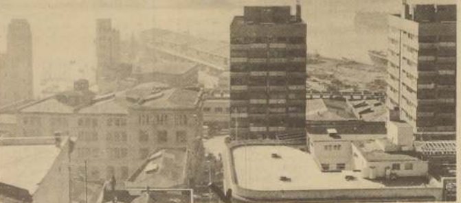
Valparaíso tiene Monumentos franceses, italianos, argentinos, ecuatorianos, colombianos, brasileños, etc. a los que hoy se incorporará, por primera vez, una estatua de Isabel La Católica que será enviada desde España. Los porteros buscan el lugar en que será colocada, que podrá ser el centro mismo de nuestra ciudad-puerto.

Corresponsalía del Diario "La Nación" Condell 1281 Teléfono 50778