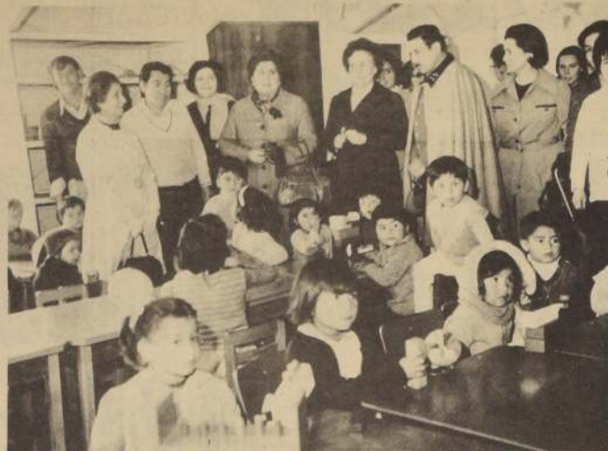
Los invitados a la inauguración del Jardín Infantil de la Población Los Eucaliptos, recorren el local, que cuenta con todas las comodidades para atender a niños de hasta 6 años.

Las solicitudes se reciben en Avenida Bulnes 285, 7° piso, Oficina 703, Santiago.