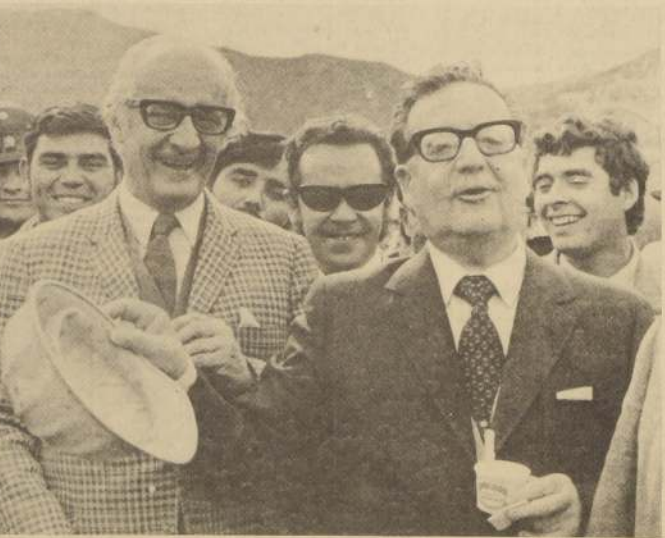
El Presidente de la República disfruta de un momento de agrado durante la fiesta ofrecida en la inauguración del Túnel de Chacabuco.

—Así fue como empezaron las conversaciones con las representantes de la Junta Nacional de Jardines Infantiles. Conseguimos los terrenos y luego vino el proceso de construcción, y el resultado se puede ver hoy día,