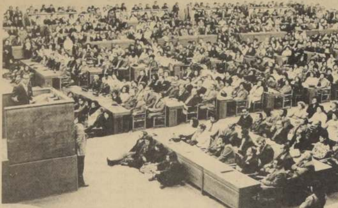
Representantes de todas las actividades, alrededor de la educación básica, asistieron a la iniciación del Plan Nacional de Mantenimiento de Escuelas, en la sala plenaria de UNCTAD, que aparecen en la foto, escuchando al Presidente Allende.

La formación del Comité Nacional, regional y local, ha comenzado a efectuarse y en pocos días más, el plan total comenzará a andar.