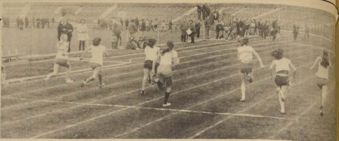
Estrecha llegada para una prueba de velocidad. Los escolares están haciendo deporte con mucho interés.

El puntaje final de este Campeonato favoreció al Colegio Consolidada El Salto, tanto en varones como en damas. La ubicación y el puntaje de los establecimientos participantes fue el siguiente: DAMAS: 1. Consolidada El Salto, con 42 puntos; 2. Colegio Argentino, con 40 puntos; 3. Liceo N. 25, con 14 puntos; 4. Liceo Hombres N. 12, con 10 puntos; 5. Liceo Ninas N. 1, con 10 puntos; 6. Juan Antonio Ríos, con 7 puntos; 7. Liceo Ninas N. 3, con 3 puntos y 8. Liceo N. 18, con 1 punto. VARONES: 1. Consolidada El Salto, con 37 puntos; 2. Liceo de Hombres N. 7, con 34 puntos; 3. San Marcos, con 17 puntos; 4. Liceo de Hombres N. 18, con 15 puntos; 5. Luis E. Izquierdo, con 13 puntos; 6. Liceo de Hombres N. 25, con 9 puntos y 7. Juan Antonio Ríos, con 5 puntos.