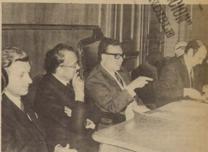
EL PRESIDENTE de la República, Salvador Allende, explica los alcances y el significado de la política automotriz del Gobierno Popular, así como del convenio firmado con la empresa automotriz francesa Citroën. En primer plano, el Presidente-Director General de