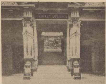
Tribunales de Justicia