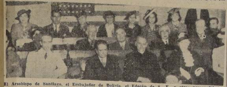
El Arzobispo de Santiago, el Embajador de Bolivia, el Edeán de S. E. y otras personalidades, durante el acto de ayer en el Bando de Piedad.

Ante una concurrencia que llenaba totalmente el salón de actos del Bando de Piedad de Chile, ayer, poco después de las diez de la tarde, se efectuó en esta institución un significativo acto cultural en honor del H. Consejo Directivo de la Defensa de la Raza y Aprovechamiento de las Horas Libres.