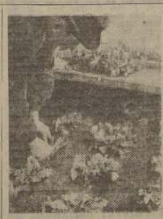
Colocando las plantas en plantaciones

A fines de enero las hojas empiezan a madurar, entonces se cortan todas las hojas que están sobre la plantación y se sacan las raíces, colocándolas en una zanja de 20 a 25 cms. de profundidad y a unos 40 a 60 cms. de ancho. Esta zanja se