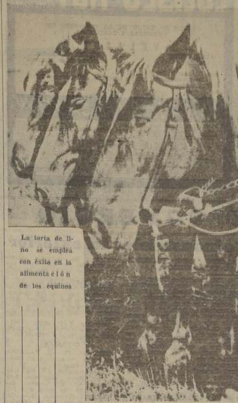
La torta de lino se emplea con éxito en la alimentación de los equinos

Los alimentos concentrados, estimados como suplementos nutritivos, para la alimentación del ganado, se obtienen en su mayoría de la elaboración de otros productos. Las tortas, residuos del aceite de lino, al-