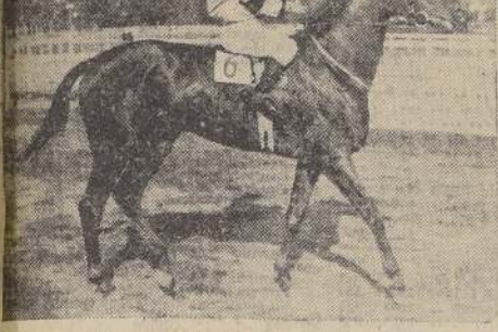
Morea, por Tagore y Mlle de Clermont, de propiedad del Stud Oasis, después de ganar el clásico José Luis Larraín. Jockey: C. Sánchez

que corrió sin contratiempo de ninguna especie, apenas pudo clasificarse cuarto, correspondiendo el triunfo a Morea, que se impuso al galope, siendo la nueva pupila de Breque, precisamente, la menos cotizada.