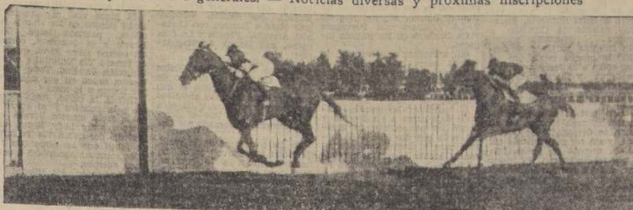
Morea bate al galope en el clásico José Luis Larraín a Juan Tenorio, Amateur y Pacasmayo

Relación y resultados generales. — Noticias diversas y próximas inscripciones