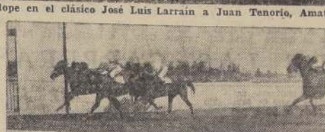
Juan de Segura, da cuenta de Tántalo, Soltura y Happiness en una de las series de productos perdedores

A un tren muy lento se cubrieron las primeras distancias y la prueba no tuvo variación hasta la recta final, en donde Soplo, Neuvieme y Haviland avanzaron