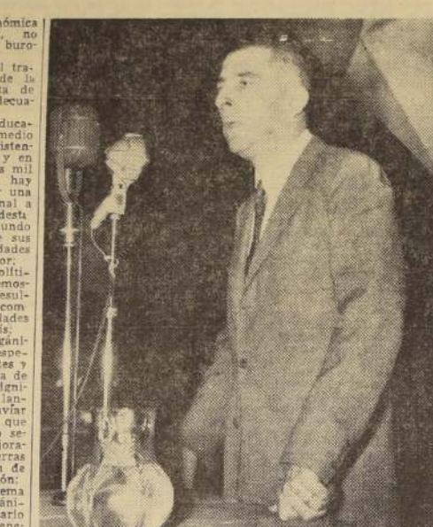
Eduardo Frei, candidato a la Presidencia de la República