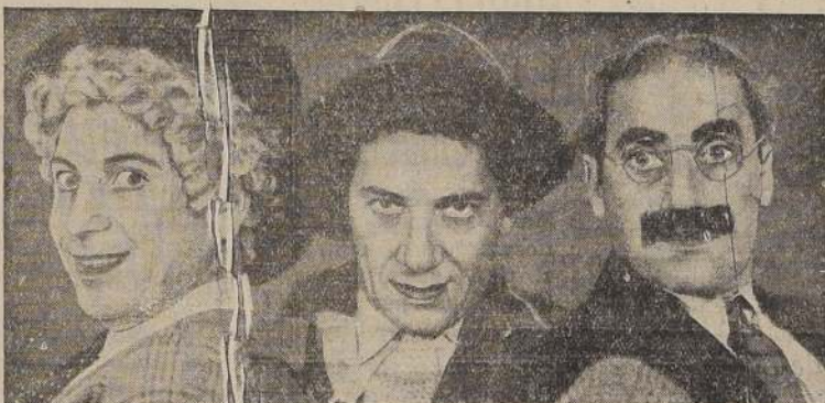
Chico, Groucho y Harpo, los tres famosos hermanos Marx, intérpretes de "Una noche en la ópera", que estrenará el Teatro Metro

Aunque parezca increíble, los hermanos Marx — esos festivos y despreocupados cómicos — (han tenido sus tribulaciones. En un tiempo la situación económica de la familia Marx era tan apurada, que apenas podía pagar las lecciones de piano de uno de los muchachos. "Chico" fue elegido futuro músico de la familia, y en poco tiempo pudo obtener trabajo en teatros de élite.