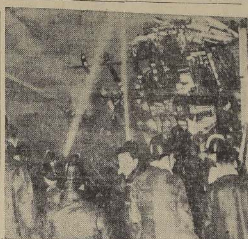
El fuego se propaga rápidamente. El incendio en la calle Moneda destruyó casi totalmente las papelerías Horeau e Inglesa. — Se desconocen las causas que ocasionaron el siniestro

Los bomberos en acción. La alarma desde una casa comercial de la calle Moneda, las bombas acudieron en el acto al lugar del siniestro, y toma-