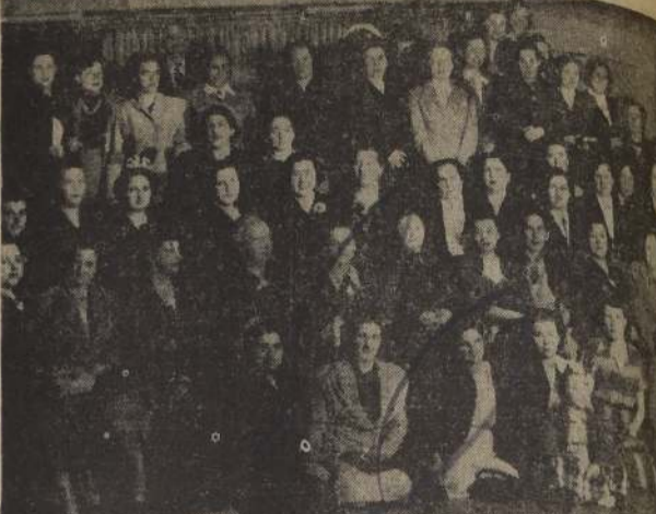
EN EL GOYESCAS.—Manifestación ofrecida en los salones de la Confeitería Goyescas, en honor de las señoras que han venido de provincia a par en el Congreso de la Industria de panaderías, en Santiago

HABITACION Y RENTA AV. REPUBLICA 12 al 33 Son cuatro casas, 617 metros de terreno, 1.540 metros edificadas. Se vende en solo $ 2.200.000.— Precio único. SIN COMISION AGUSTINAS 972 Piso 3.º - Oficina 317 TELEFONO 67195 De 3 a 6 P. M.