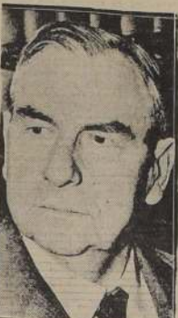
El juez Harlan Stone, presidente de la Corte Suprema de Estados Unidos

WASHINGTON, 22. (U.P.). — Falleció el presidente de la Corte Suprema, Mr. Harlan F. Stone.