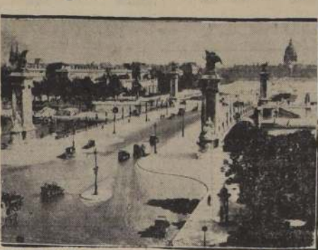
Vista de París tomada desde el Puente Alejandro III; al fondo se advierte la cúpula de los Inválidos