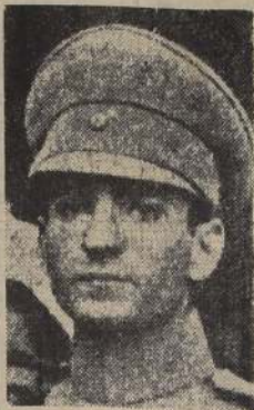
Mohamed Phalevi, Sha del Irán

Los miembros de la partida de salvamento dicen que aparentemente el piloto chocó con árboles y se precipitó contra terreno rocoso, pereciendo todos sus ocupantes.