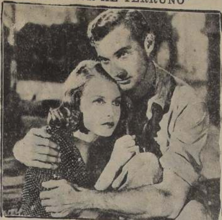
Una escena del fuerte drama de Jean Renoir, "El amor al terruño", que se estrenará en las pantallas locales.