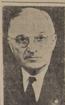
El Presidente Truman

LONDRES, 22. — (Agence France Press). — Averill Harriman, nuevo Embajador de los Estados Unidos, llegó temprano esta mañana a Londres, por vía aérea, Reemplaza a Winant, designado representante norteamericano en el Consejo Económico de las Naciones Unidas.