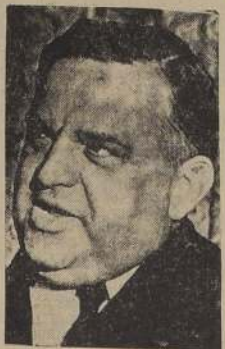
Mr. Fiorello La Guardia

WASHINGTON, 22. (U. P.). — El General de la UNRRA, el Comandante de la América Latina, pidiendo ayuda a los pueblos de Europa y Asia, para que se les ayude a combatir la hambruna. En la palabra en el especial de la NBC, las naciones hispanoamericanas en que también se habla de la Guardia.