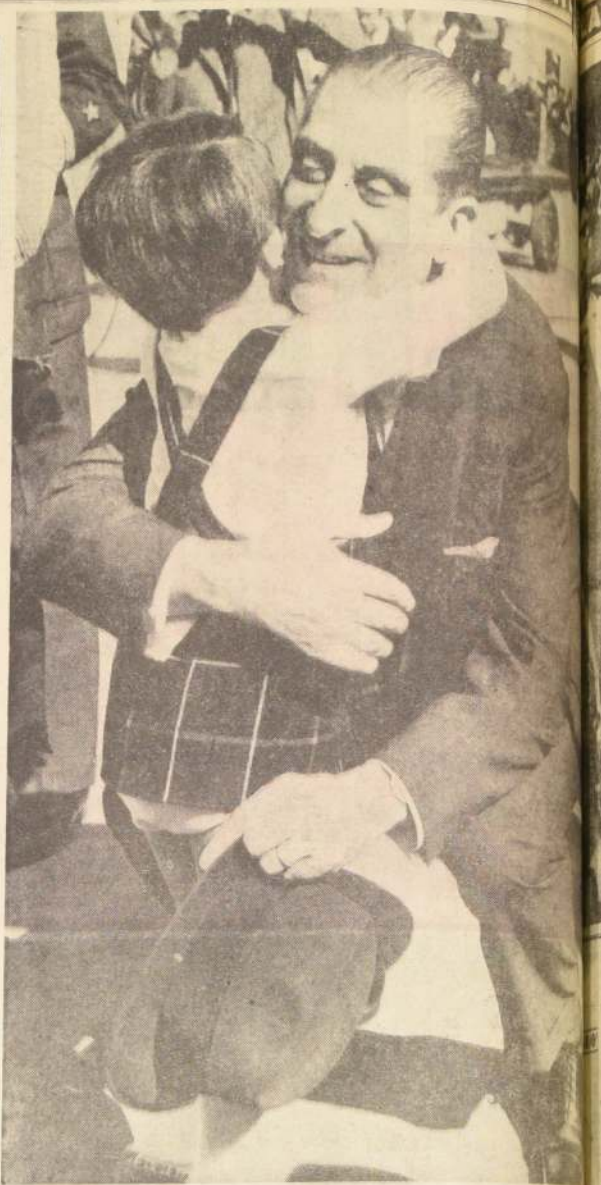
En Brasil, y en cada una de las ciudades que visitó —también en Santiago— el Presidente Frei rompió el protocolo en múltiples ocasiones. La prensa brasileña destacó este gesto del Mandatario como uno de los más característicos de la sencillez con que actúa da uno de los actos oficiales a los que asistió. En el campo aéreo rompió cualquier forma de protocolo cuando recibió el saludo de sus nietas, a la que abraza con no disimulada emoción.

Momentos más tarde, Santiago ya estaba a nuestro alcance. Regresábamos a la Patria luego de ocho días de ausencia. Sintiendo el deseo del retorno. Pero al mismo tiempo, recordando que habíamos cumplido una misión profesional que, aparte de ella, tenía el incentivo de haber colaborado en algo con la causa de la integración latinoamericana y en la construcción de "un mundo nuevo para una América Joven".