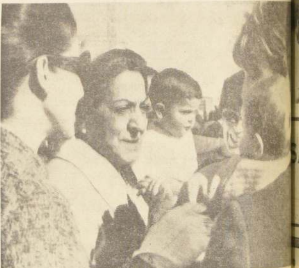
La recepción en Pudahuel tuvo un aparte emotivo. Fue el saludo de los hijos del Presidente. En el grabado, la Primera Dama, señora María Ruiz Tagle de Frei, muestra la emoción que le produce el encuentro.