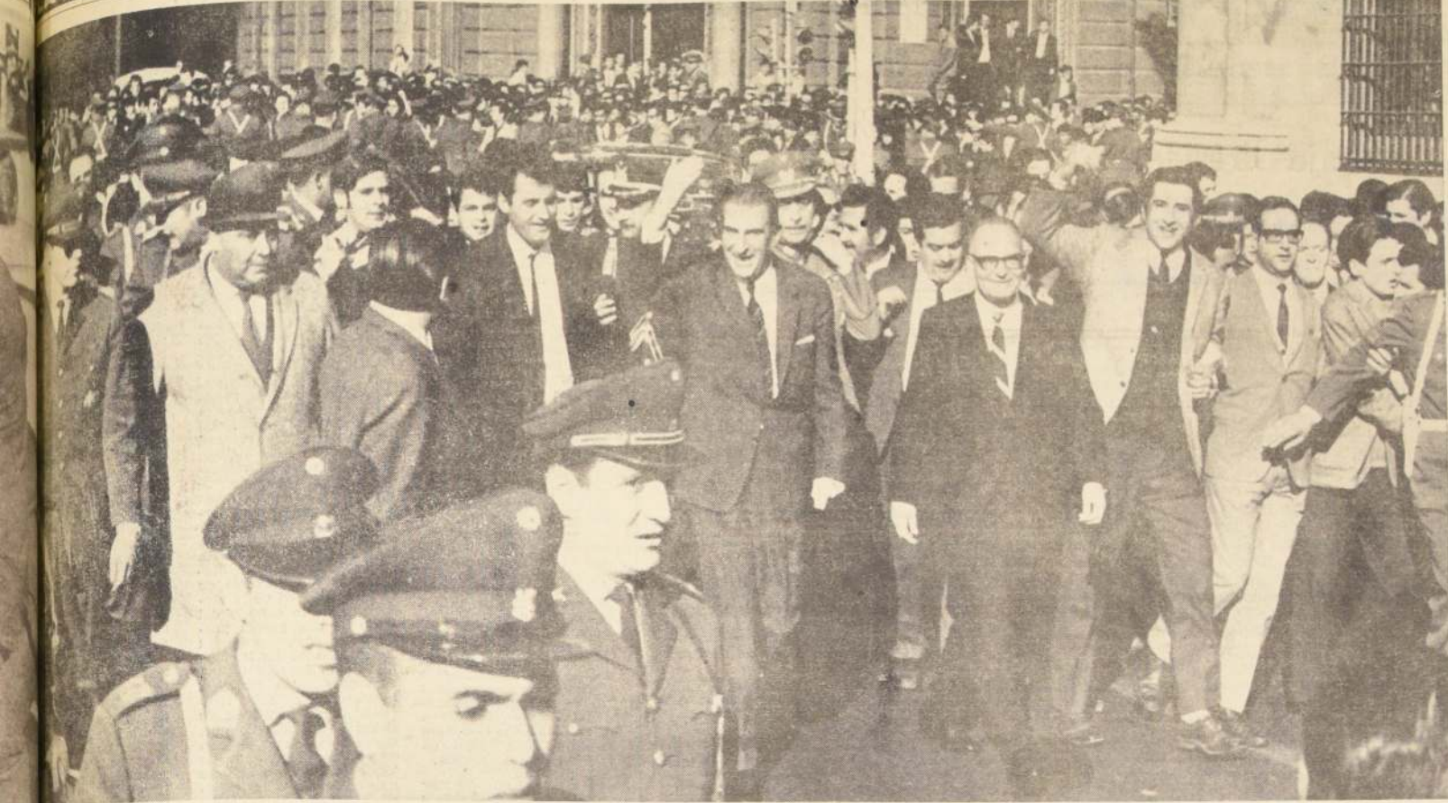
Rompiendo el protocolo de rigor, el Presidente Frei llegó a la Moneda, a pie. Cuando hizo su aparición por la calle Moneda, el público estacionado allí, en una imponente y espontánea concentración, se abalanzó para saludarlo. El grabado muestra al Jefe del Estado respondiendo a los saludos de la multitud. Junto a él, el Ministro del Interior, Edmundo Pérez Zujovic.