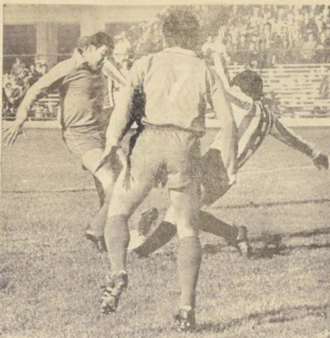
ARAYA, de espaldas a la cámara, fue el único delantero de la "U" que se acordó que era su deber atacar.

La "U" juega esta noche con la selección de la "U" penquista y mañana sábado con la selección de la Asociación de Concepción.