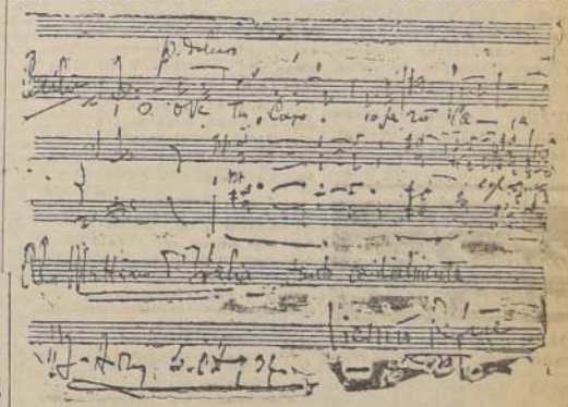
Música y autógrafo del autor de "Cecilia", Monseñor L. Refice

Atractivo artístico de relieve significa el estreno absoluto para Chile, de la ópera sacra de Monseñor Licio Refice, intitulada "Cecilia" y que la compañía lirica que realiza la temporada oficial en el Teatro Municipal anuncia para mañana miércoles. Debemos consignar que esta inspirada composición operística fué estrenada en Roma en el año 1934, y después de su primera representación se impuso a la consideración del público y de la crítica. Posteriormente ocupó los escenarios más prestigiados de Europa y últimamente se cantó en el Com-