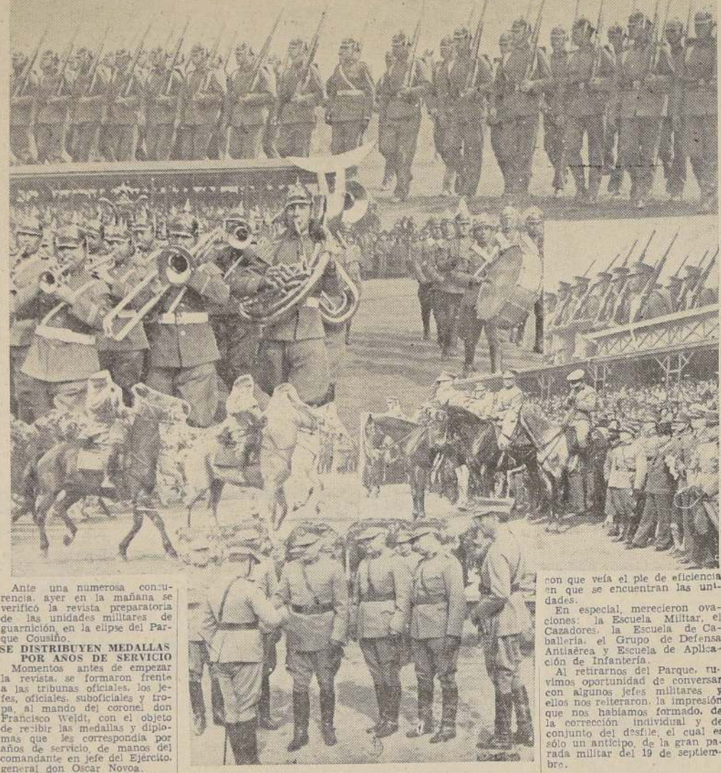
Diversos aspectos de la revista militar preparatoria efectuada ayer en el Parque Cousiño

ENTREGA DE MEDALLAS Y DIPLOMAS POR AÑOS DE SERVICIO