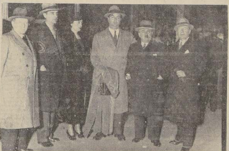
El baritono Carlos Morelli, a su llegada a Santiago, acompañado de representantes, empresarios y críticos que lo recibieron anoche en la Estación Mapocho.

Ayer ha llegado a la capital el baritono chileno Carlos Morelli, el prestigioso artista lirico que viene a integrar el brillante elenco de la Compañía Lirica, que enriquecerá la línea de figuras de primera categoría que este año ha podido reunir la Empresa del Municipal. En la estación Mapocho, Morelli fué recibido con entusiasmo por numeroso público, por empresarios teatrales y periodistas que saludaron cariñosamente al cantante que llega a su país cargado de laureles conquistados en su triunfal carrera lirica por los más grandes escenarios de Europa, Estados Unidos y Sud América. Carlos Morelli, se presentará al público, el viernes próximo, con la grandiosa ópera de Gio. dano "Andrea Chenier", obra que siempre ha dado al prestigioso baritono, éxitos resonantes. Será velada de gala, e intervendrán en la obra, Alida Vane y Pedro Mirasol. El cable que nos envió nuestro compatriota dice así: Mi primer pensamiento al llegar a la patria es de agradecimiento por la cordial acogida de su diario, saludos.— CARLOS MORELLI