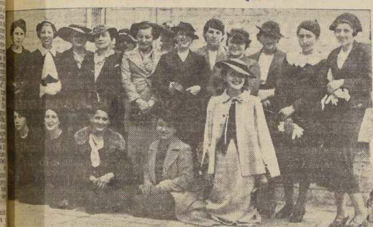
Las alumnas del Liceo de Talca durante su visita a "LA NACION"