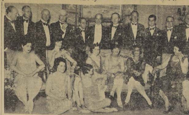
Asistentes a la comida ofrecida anoche por el conde de la Embajada de Estados Unidos en honor del Embajador de España y señora.