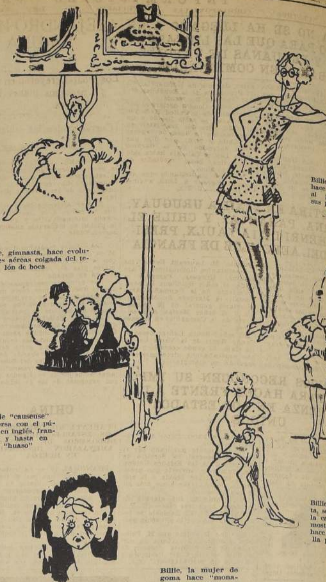
Billie, gimnasta, hace evoluciones aéreas colgada del telón de boca

VERMOUTH: La hermosa película: RENDICION Sólo para mayores