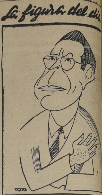
El Presidente de Bolivia, Excmo. señor Paz Estenssoro, frente al abortado movimiento revolucionario de su país, recibió, nuevamente, el apoyo incondicional de la prensa.