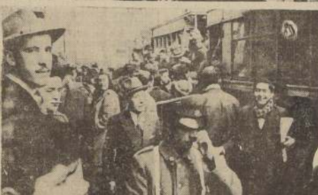
Espectáculo que presenciaron ayer, motivado por la falta de microbuses. Tranvías y góndolas transformados en verdaderos raíles humanos.

la fecha para reanudar los servicios de petroleros norteamericanos, sin perjuicio de las gestiones que realiza el Gobierno para mejorar esta situación.