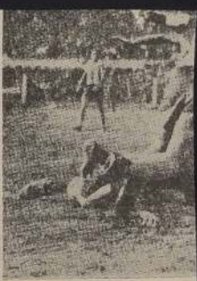
A LOS 7 MINUTOS.— Pin, z... cia, quiere tomar la pelota, p... el triunfo a Argentina sobre los 7 minutos de in...

Las astas aparecieron desnudas. Sólo una bandera flameó en el luminoso escenario: la de la Asociación Uruguaya. En cambio, las ovaciones atronaron el espacio, siendo de destacar que fueron más sostenidas al coincidir con la entrada de la visita. Cuando los adversarios realizaban sus ensayos frente a los arcos, se paralizaron de pronto para oír las canciones patrias de ambos países hermanos. En seguida los capitanes, en vez de flores, trocaron banderines. Los consabidos hurraes arrancaron los aplausos de siempre. La expectación crecía. Es que el público sabía de la mentalidad del once argentino y no estaba realmente convencido de que la selección celeste dispusiera de cohesión de pensamiento, de eficacia. Y los hechos confirmaron sus temores. En la cancha se vieron dos fuerzas distintas. Una de notable suficiencia, de notable compensación, de destreza máxima que, empero, padecía de un error fundamental: su carencia de control por parte de los delanteros en los tramos decisivos. De coraje y de afán. La otra, sin plan de juego, desahogada e incoherente en el sector ofensivo, se veía obligada a defenderse y lo hacía, en realidad, con visibles dificultades. Para el espectador imparcial, desvinculado de las cívicas, simplemente objetivo, el