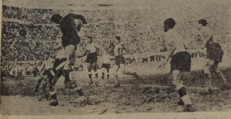
CORNER PARA ARGENTINA.— Sud, el veloz e inteligente puntero de Racing Club, ha shotear a Pa, en notable esfuerzo, neutralizando el tiro, pero cediendo corner. El match disputado en el Estadio Centenario, de Montevideo, por la Copa Lipton, terminó en empate a dos goles. Posteriormente, Stabile ha dicho que su equipo jugó muy bien.

TODOS LOS ARTICULOS DE ESTA LIQUIDACION ESTAN GARANTIZADOS EN SU CALIDAD POR MODAS TOTU ARTURO PRAT 24