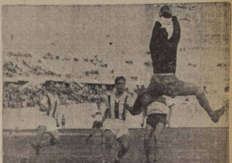
LIVINGSTONE SE EMPLEO SERIAMENTE.— El guardavallas internacional y el mejor del país en la actualidad, Sergio Livingstone, tuvo mucho trabajo frente al Green Cross, sobre todo en el segundo tiempo. La instantánea lo muestra interviniendo ante un lanzamiento alto y amagado por Zúrate, el notable insíder de los vencedores.