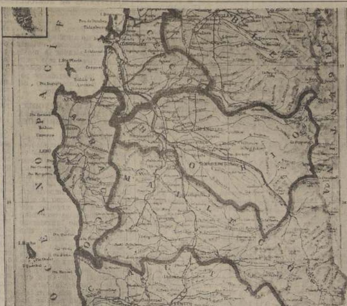
Este croquis muestra la zona del sur afectada por el violento temporal, que ha causado cuantiosos daños materiales, pérdidas de vida y dejado sin habitación a numerosas poblaciones. Concepción, Angol, Temuco y otras importantes ciudades han sido las más afectadas por las inundaciones que ha originado la crecida de los ríos.