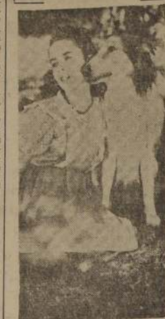
ELIZABETH TAYLOR y "Lassie", el astro camino, cuya camaradería forma la base de la dramática historia narrada en "El valor de Lassie", nuevo éxito de la Metro Goldwyn Mayer, que se estrenará en el cine Metro.

En esta nueva muestra filmica que podremos conocer el martes en el cine Santiago, el amante al séptimo arte podrá jugar este