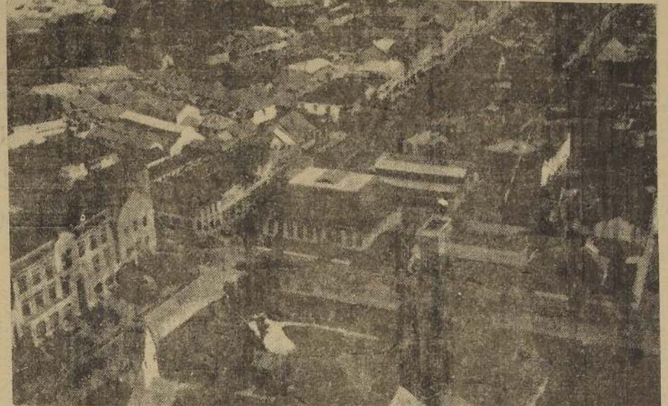
Vista aérea de Medan, capital de la isla de Sumatra, Indias Orientales Holandesas