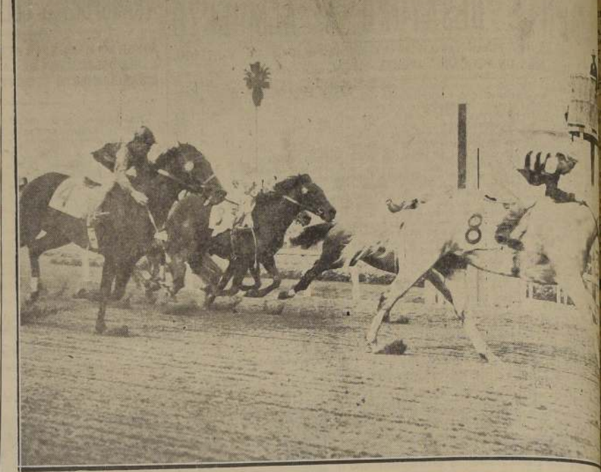
En violenta atropellada final, el torbellino Olhaverry (8) cruza victorioso la raya por medio cuerpo sobre Saint Simon (dentro), sorprendiendo a la cátedra y ganando los cien mil dólares del famoso Handicap de Santa Anita. El gran favorito Armed, se agotó en la recta. Lo Tercero llegó Pere Time (4), y cuarto See-See-See (3). El gran favorito Armed, se agotó en la recta. Olhaverry pagó 32.70 dólares por unidad de 2.—(Foto ACME)