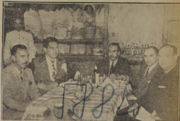
Asistentes a una manifestación en la Taberna del "Capri" al campeón sudamericano de box Arturo Godoy por un grupo íntimo de sus amigos. — Diariamente la "Taberna" se ve realizada por un numeroso público que la ha hecho su punto obligado de reunión, bailándose en la noche con la música rítmica del conocido y popular acordeonista Maldonado y Lucha Silva, con su guitarra y citarra que tanto éxito obtuviera en los hoteles de Puerto Varas y Pucón.

MATERNIDAD "LUIA KAPLAN" ARTURO PRAT N.º 139 TELÉFONO: 83128 SERVICIO MEDICO PERMANENTE