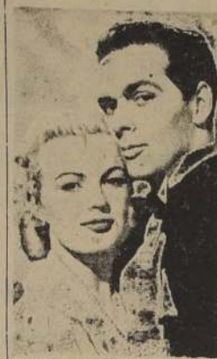
"Las Dolly Sisters", es la más lujosa comedia musical que se ha producido en la fecha en los teatros americanos.

El argumento se desarrolla en un ambiente comopolita con escenas de un comediante interesantísimo. Los mejores cabarets del mundo aparecen en la pantalla, convirtiendo al film mencionado en una verdadera epopeya del espectáculo trivial y alegre.