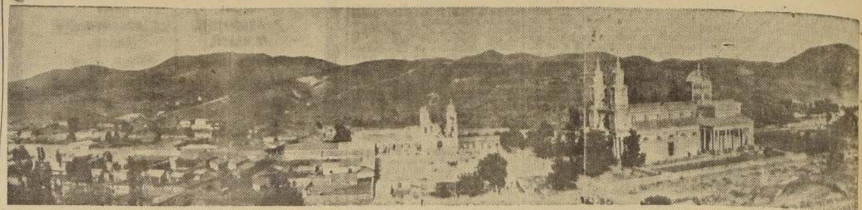
Vista panorámica del pueblo de Andacollo, en cuyo interior se han producido las inundaciones

ARDUA LABOR HA DESPLEGADO LA DIRECCION DE AUXILIO SOCIAL