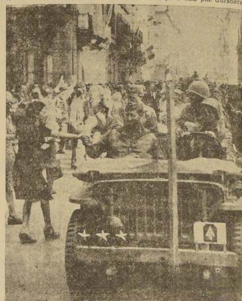
En esta sensacional fotografía vemos al general norteamericano Mark Clark, libertador de Roma, pasando por una calle de Roma en un jeep y estrechando la mano de un joven, entre las aclamaciones entusiastas de la multitud que lo saluda con la V de la Victoria

"En nuestro convencimiento que tal proceder significará la más sólida base para una paz duradera."