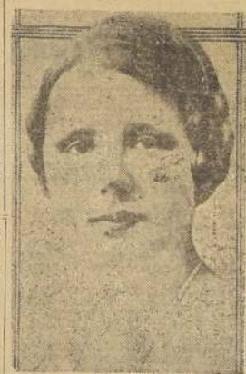
Princesa Juliana las primeras horas de la mañana a atender en su oficina, como de costumbre, la administración de las propiedades de su madre, la Reina Guillermo.

LA HAYA, 30. — Miles de telegramas de todas partes del mundo han llegado hoy a la Princesa Juliana, heredera del trono de Holanda, en que se la felicita por su 22º cumpleaños. A pesar de las muchas fiestas en su honor, la popular Princesa dedicó