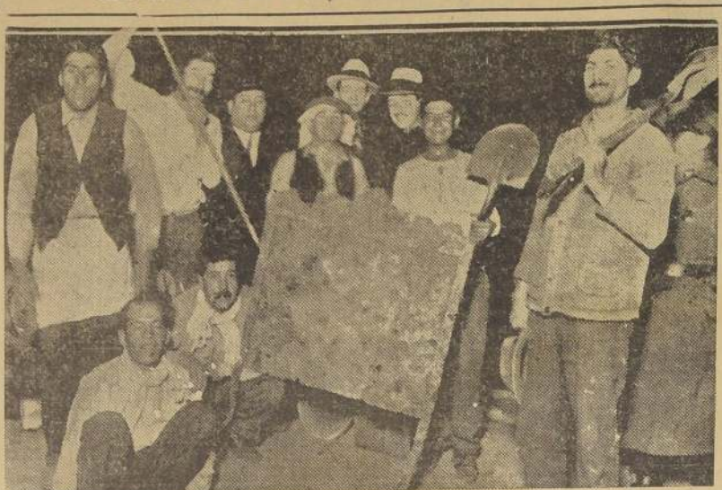
Puerta de hierro que cubría la entrada del subterráneo secreto encontrado ayer.