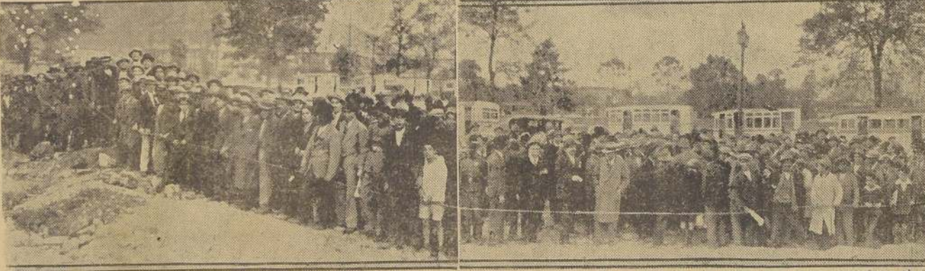
de la mañana de ayer este público, mantenido en línea con cordones y policía, contemplaba los trabajos de excavación para encontrar el tesoro.