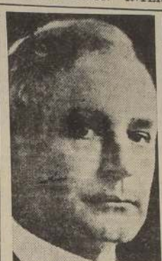
Mr. Cordell Hull

todos los ciudadanos; tercero: buena disposición de parte de cada nación de someter sus diferencias con cualquiera otra al arbitraje pacífico. Mr. Hull dijo asimismo que la aceptación por parte de Estados Unidos de los principios mencionados es obligatoria por el sólo hecho de haber propiciado durante tanto tiempo ciertas creencias que ya están ampliamente esparcidas y grabadas en las mentes de los pueblos, entre las cuales menciona, primero: todos los pueblos que se hacen dignos de asumir y desempeñar las responsabilidades de la libertad tienen derecho a gozar de ella; segundo: cada Estado soberano, grande o pequeño, será igual a cualquiera otra nación bajo la ley; tercero, todas las naciones respetarán los derechos de las otras a veres libres de interferencias extranjeras en sus asuntos internos; cuarto: buena voluntad para arreglar las disputas internacionales pacíficamente; quinto: es esencial que no haya discrepancias en el tratamiento dado a unos y otros en cuanto a oportunidades económicas si es que ha de mantenerse una base sana para las relaciones internacionales; sexto: la cooperación de buena voluntad entre las naciones es el método más eficaz para salvaguardar el bienestar de este y los demás países.