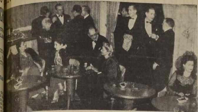
Baby Bar del Roof Garden, durante un cocktail antes de los dinner-danzantes.