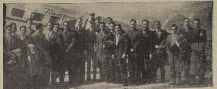
Miembros de la delegación de estudiantes peruanos de la Universidad de San Marcos, de Lima, que ayer arribaron a Santiago, en un avión especial de la Línea Aérea Nacional, procedentes de Arica.

CONTINUAN LLEGANDO DELEGACIONES DE DISTINTOS PAISES DEL CONTINENTE