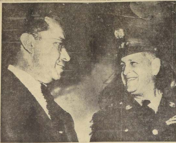
PAZ ESTENSSORO EN BOGOTA.— BOGOTÁ.— El Presidente de Bolivia, Victor Paz Estenssoro, es saludado por el Primer Mandatario colombiano, teniente general Gustavo Rojas Pinilla, al descender Paz Estenssoro del avión en el aeropuerto de Bogotá, con lo que inició una visita de cuatro días a Colombia.