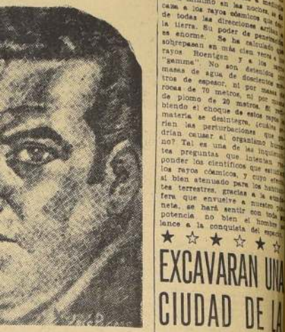
P. D.: Le adjunto un ensayo sobre su obra que ofrezco a su consideración y que puede ser publicado. Evite las citas por reverencia a la integridad de sus poemas. Recuerdo las palabras maravillosas de Winétt: "Entre nosotros, nadie espigará en su campo."

El buscador no se verá defraudado; encontrará un idioma total que repandee con imágenes de fuego; una impudencia sin barreras en la protesta, en la ponderación, en la dulzura; una palabra vi-