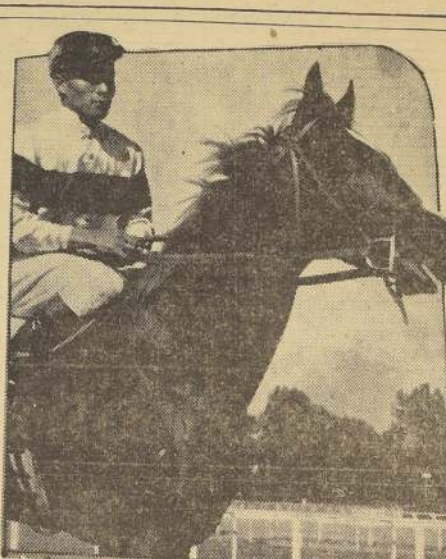
CORONADO, uno de los favoritos en el clásico "Uruguay", del Club Hípico, sobre 2.400 metros