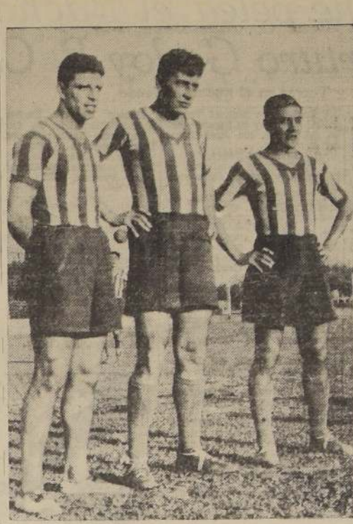
La línea media de Rosario Central