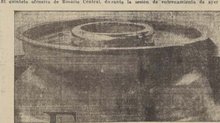
PAJILLA para la preparación de dinamita, prensada de una sola plancha de 19 mm. por la Lukens Steel Company (E. U.) para la E. I. du Pont de Nemours Co. (E. U.) Peso, 1560 mm.; diámetro, 3,25 metros