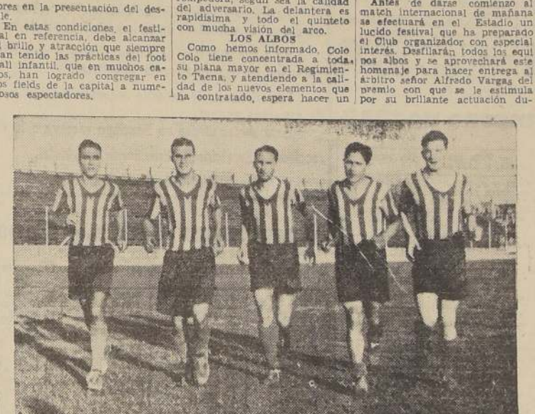
El quinteto ofensivo de Rosario Central, durante la sesión de entrenamiento de ayer