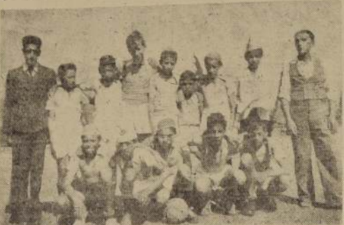
Componentes del equipo infantil de Petorca, que tuvo una brillante actuación en los últimos partidos celebrados en nuestro estadio. Venció al último Chincolo por la cuenta mínima.

Ayer: ALIANA MARIA de Coquimbo JUNIN de Iquique. ALEJANDRO, para Coquimbo Hoy: HUELLEHUE, de Coquimbo. MADONA. VINA DEL MAR de P. Arenas LONTUE de Iquique. HUELLEN, de los Vilos. SALIDAS AYER: TAVIS, para Huasco. Hoy: ALBA para Antofagasta. ALBA, para Coquimbo. ALFONSO, para Coquimbo. Viernes 10: ALEX, para Guayaquil. LONTUE, para Iquique e intermedios. HUELLEN, para Antofagasta. HUELLEHUE, para Coquimbo.