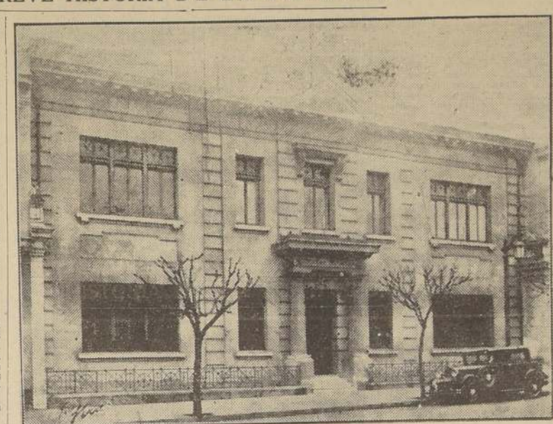
Frontis del edificio de la Academia de Guerra