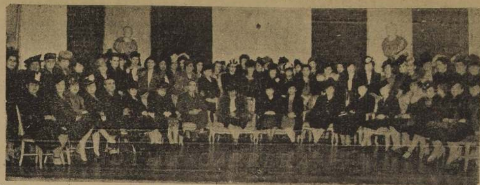
Grupo de asistentes al té ofrecido por la Asociación de Damas Universitarias, con motivo de la celebración del aniversario de dicha entidad.