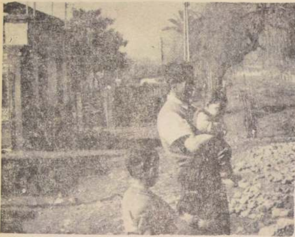
LOS BARRIOS POPULARES son verdaderos "peladeros", donde escasean árboles para purificar el aire enrarecido por las fábricas.

En las calles de Santiago hay un árbol por cada 16 personas. En Pekín hay uno por cada 10. En Montevideo, un árbol por cada 8 personas. El aire que estamos respirando en la capital es venenoso. El remedio está en las plantas y en los árboles, que purifican el aire.