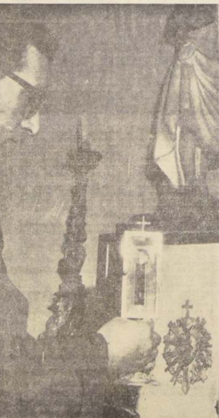
La sangre de Fray Andresito es mantenida cuidadosamente en una esfera de cristal. En su nombre, diariamente se pagan muchas mercedes. Los feligreses hay que buscarlos entre los rudos hombres que trabajan en la Vega Central. Son ellos los que han idealizado esta obra de un sacerdote que merece ser canonizado.

El pensamiento y la actitud de Fray Hernán Álvarez, implica una importancia extraordinaria desde el punto de vista de la satisfacción —por último— de las inquietudes devotas de una inmensa masa popular simplista y crédula que no se puede desconocer como realidad social.