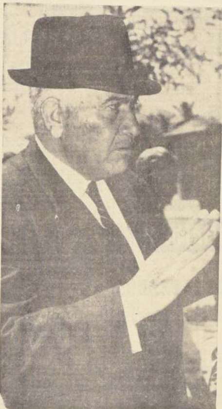
● AUGUSTO BREQUE puede llevarse las dos pruebas programadas para valores de "dos años". Canadian Lord y Gran Vital lucen buen estado.

Reunión extraordinaria tenemos esta tarde en la pista del Club Hípico. El programa comenzará a las 14 horas para terminar a las 19 horas y 15 minutos. Doce competencias conforman la jornada que tiene una prueba central sobre el trayecto de 1.000 metros.