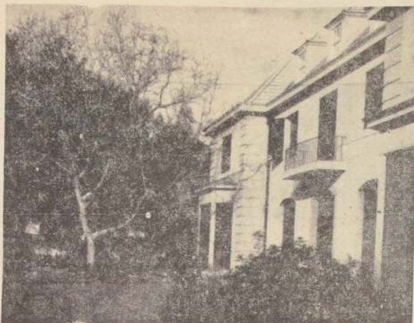
LOS BARRIOS donde vive la gente pudiente son verdaderos verdes, donde los niños respiran aire puro.