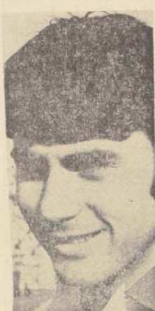
LAUBE es nuevamente un "hombre libre".

No quiero continuar en O'Higgins y por eso deseo irme a Wanderers", es la decisión final del defensor rancaguino.